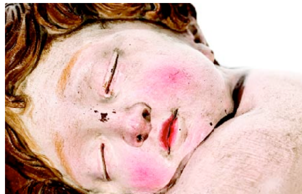
Nen Jesús adormit abraçant la creu Anònim espanyol Segle XVII

Els tresors artístics guardats a les clausures dels convents i monestirs madrilenys són capaçs de transmetre les profundes i intenses formes de religiositat com a expressió del món de silenci i recolliment interior que envolta la vida de les congregacions religioses. Però també constitueixen peces fonamentals de la història del patrimoni cultural d'una societat, de la que els propis convents i monestirs en són part en l'intricat, i de vegades misteriós, conjunt de relacions que molts homes i dones establiren i estableixen amb el seu Déu. Un patrimoni històric que ha anat deixant les seves petjades profundes i contundents de vegades, amb prou feines imperceptibles i delicades d'altres, per passar a formar part de la memòria col·lectiva de tota una societat.