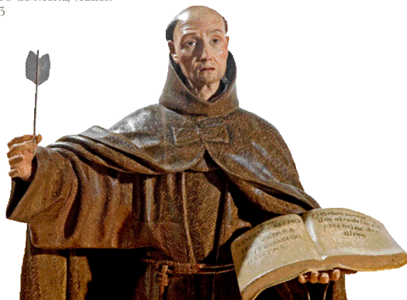
San Pedro de Alcántara Pedro de Mena, (Taller) 1663

Quan el soroll tot ho envaeix i arriba a ser insuportable, el silenci és un bé preuat que es fa imprescindible. I en el silenci la veu interior es torna audible i el seu murmuri arriba per fer-se present d'una manera misteriosament callada. És el gran silenci de l'interior de les clausures. I en aquesta clausura triada, amb una alegria i felicitat que brolla des del més profund, potser d'una manera incomprensible, les seves residents troben la pau precisa per trobar sentit a les paraules del salm 19: Des del profund a tu clamo Senyor, escolta la meua veu. A l'aixopluc de les comunitats que les congrega i per l'esperit que va animar els seus fundadors i fundadores, guarden amb cel la història i l'art que tanquen entre els seus murs. I aquest patrimoni amagat és el que surt ara per ser mostrat a tots. Aquests tresors artístics, que donen sentit a l'expressió d'un sentiment religiós, constitueixen, també, l'expressió de l'art del seu temps.