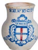
Jarro de beber Talavera de la Reina Segunda mitad del siglo XVIII