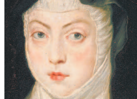
Retrato de Sor Ana Dorotea de Austria Pedro Pablo Rubens 1628

los tesoros artísticos guardados en las clausuras de los conventos y monasterios madrileños son capaces de transmitir las profundas e intensas formas de religiosidad como expresión del mundo de silencio y recogimiento interior que rodea la vida de las congregaciones religiosas. Pero también constituyen piezas fundamentales de la historia del patrimonio cultural de una sociedad, de la que los propios conventos y monasterios son parte en el intrincado, y a veces misterioso, conjunto de relaciones que muchos hombres y mujeres establecieron y establecen con su Dios. Un patrimonio histórico que ha ido dejando sus huellas profundas y contundentes unas veces, apenas imperceptibles y delicadas otras, para pasar a formar parte de la memoria colectiva de toda una sociedad.