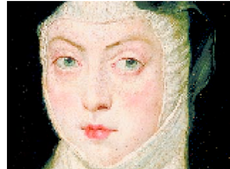
Retrato de Sor Ana Dorotea de Austria Pedro Pablo Rubens 1628