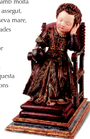
Nen Jesús adormit Escola espanyola Finals del segle XVI

I quan Maria, la verge mare, adquireix diferents rostres recordant als fidels la seva condició y esdevenint per a ells un objecte de culte, també aquests rostres expressen el profund sentit de la maternitat incitant a la tendresa, a la protecció o la bellesa interior. La representació infantil del seu fill, fet Déu, és també un altre referent que es fa present amb molta freqüència i en desenes de formes, assegut, ajagut, adormit o en braços de la seva mare, a les cel·les i les dependències privades de les congregacions religioses. Aquests Nens són també mostra de l'esmerç per donar una imatge de la condició humana en els seus primers anys de vida, adquirint aquesta doble condició de ser representacions del fill de Déu i de l'art barroc madrileny.