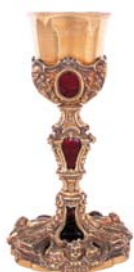
Cáliz Nápoles Anterior a 1708