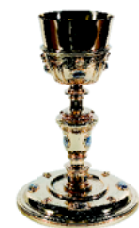
Calze Escola madrilenya o alcalaina Segon quart del segle XVII