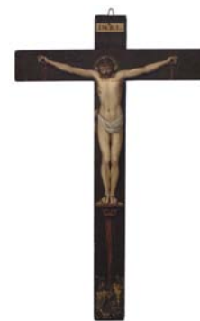
Cristo crucificado Anónimo español Siglo XVII

los tesoros artísticos guardados en las clausuras de los conventos y monasterios madrileños son capaces de transmitir las profundas e intensas formas de religiosidad como expresión del mundo de silencio y recogimiento interior que rodea la vida de las congregaciones religiosas. Pero también constituyen piezas fundamentales de la historia del patrimonio cultural de una sociedad, de la que los propios conventos y monasterios son parte en el intrincado, y a veces misterioso, conjunto de relaciones que muchos hombres y mujeres establecieron y establecen con su Dios. Un patrimonio histórico que ha ido dejando sus huellas profundas y contundentes unas veces, apenas imperceptibles y delicadas otras, para pasar a formar parte de la memoria colectiva de toda una sociedad.