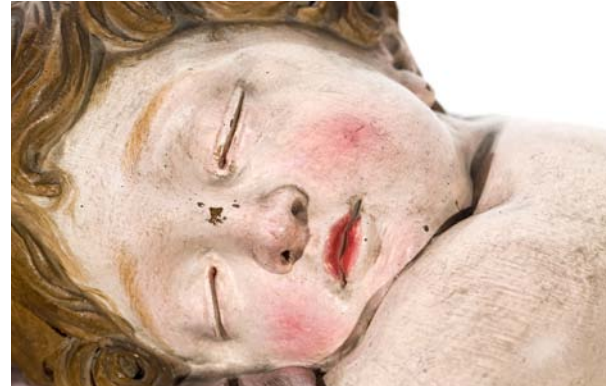
Niño Jesús dormido, abrazado a la cruz Anónimo Siglo XVII

La representación infantil de su hijo, hecho Dios, es también otro referente que está presente con mucha frecuencia y en decenas de formas, sentado, acostado, dormido o en brazos de su madre, en las celdas y las dependencias privadas de las congregaciones religiosas. Estos Niños son también muestra del esmero por dar una imagen de la condición humana en sus primeros años de vida, adquiriendo esa doble condición de ser representaciones del hijo de Dios y del arte barroco madrileño.