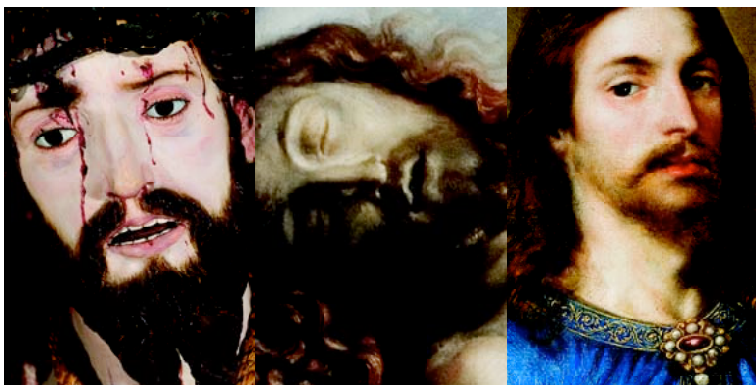
El Salvador Antonio de Pereda 1655

Els rostres d'aquells sants i santes, pintats i esculpits pels millors artistes de la seva època, que buscaven representar les virtuts que donaren sentit a les seves vides, mostren, també, la pau, la serenitat, la dolçor, o la fortalesa d'uns homes i dones del seu temps transcendint el sentit religiós per esdevenir representacions de l'art. En la decoració dels recipients i plats i en la profusa decoració de calzes, navetes i encensers, es troba el mestratge dels artesans i orfegres que van saber traslladar la tècnica i l'art del seu temps a la matèria que els dona forma. Les representacions del Déu dels cristians, en les seves formes de Pare Creador, Crist que pateix o Crist triomfant després de la Resurrecció, esdevenen, també, en la força expressiva dels gestos, les actituds i el talent de poder, de sofriment, o d'esplendor que l'esperit del Barroc va transmetre de la mà dels artistes dels segles XVII i XVIII.