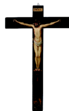
Cristo crucificado Anónimo español Siglo XVII

Els tresors artístics guardats a les clausures dels convents i monestirs madrilenys són capaçs de transmetre les profundes i intenses formes de religiositat com a expressió del món de silenci i recolliment interior que envolta la vida de les congregacions religioses. Però també constitueixen peces fonamentals de la història del patrimoni cultural d'una societat, de la que els propis convents i monestirs en són part en l'intricat, i de vegades misteriós, conjunt de relacions que molts homes i dones establiren i estableixen amb el seu Déu. Un patrimoni històric que ha anat deixant les seves petjades profundes i contundents de vegades, amb prou feines imperceptibles i delicades d'altres, per passar a formar part de la memòria col·lectiva de tota una societat.