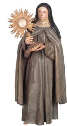
Santa Clara de Asís Pedro de Mena 1675