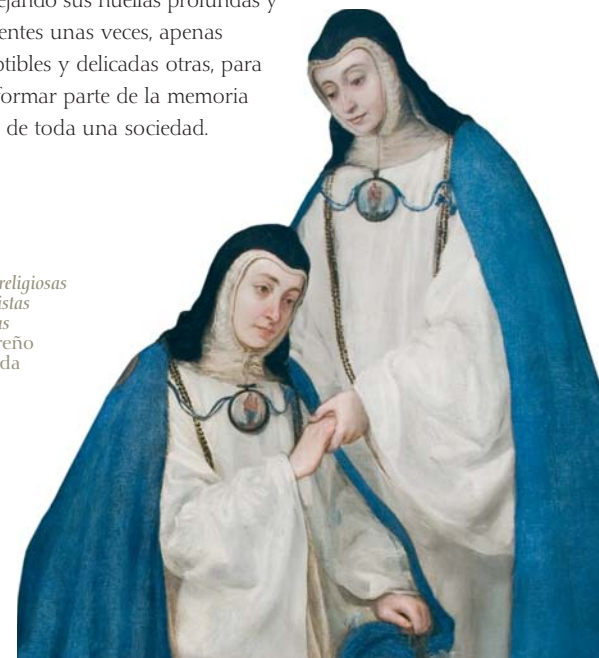
Retrato de religiosas concepcionistas franciscanas Juan Carreño de Miranda 1653