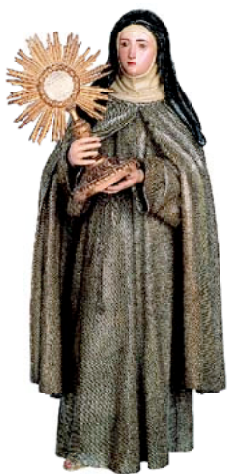
Santa Clara d'Assís Pedro de Mena 1675

Quan el soroll tot ho envaeix i arriba a ser insuportable, el silenci és un bé preuat que es fa imprescindible. I en el silenci la veu interior es torna audible i el seu murmuri arriba per fer-se present d'una manera misteriosament callada. És el gran silenci de l'interior de les clausures. I en aquesta clausura triada, amb una alegria i felicitat que brolla des del més profund, potser d'una manera incomprensible, les seves residents troben la pau precisa per trobar sentit a les paraules del salm 19: Des del profund a tu clamo Senyor, escolta la meua veu. A l'aixopluc de les comunitats que les congrega i per l'esperit que va animar els seus fundadors i fundadores, guarden amb cel la història i l'art que tanquen entre els seus murs. I aquest patrimoni amagat és el que surt ara per ser mostrat a tots. Aquests tresors artístics, que donen sentit a l'expressió d'un sentiment religiós, constitueixen, també, l'expressió de l'art del seu temps.