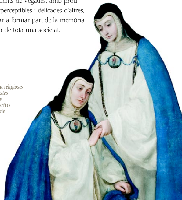
Retrat de cinc religioses concepcionistes franciscanes Juan Carreño de Miranda 1653