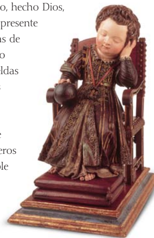
Niño Jesús dormido Escuela española Finales del siglo XVI