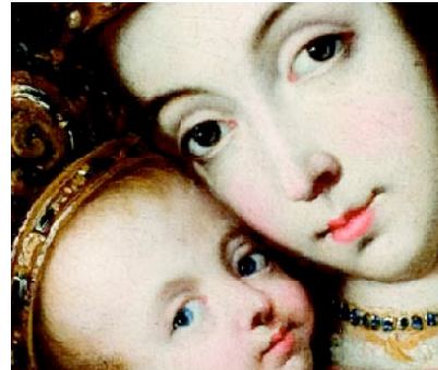
Mare de Déu de Bellem Anònim espanyol Segle XVIII