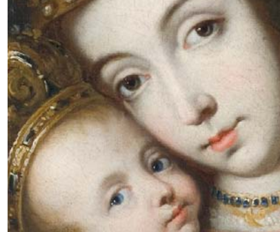
Virgen de Belén Anónimo español Siglo XVII

Y cuando María, la virgen madre, adquiere diferentes rostros recordando a los fieles su condición y convirtiéndose para ellos en un objeto de culto, también estos rostros expresan el profundo sentido de la maternidad incitando a la tenura, a la protección o la belleza interior.