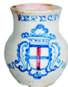
Gerro de beure Talavera de la Reina Segona meitat del segle XVIII