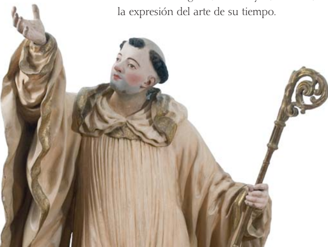
San Bernardo José de Churriguera 1720-24