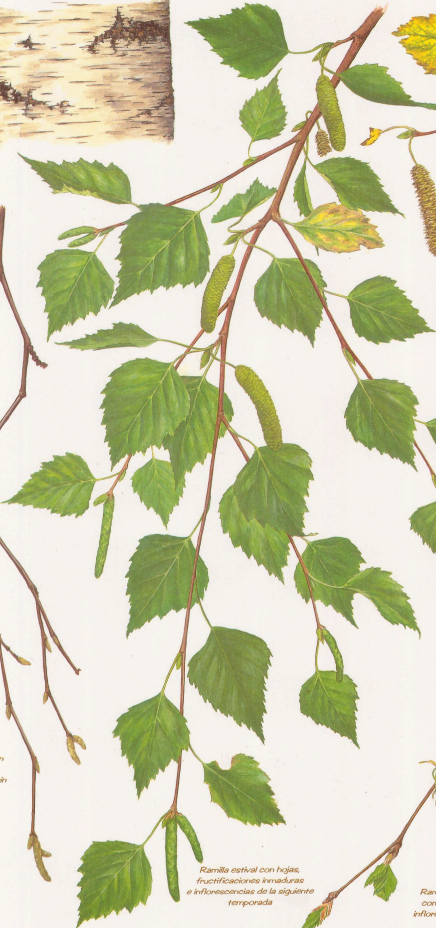
Ramilla estival con hojas, fructificaciones inmaduras e inflorescencias de la siguiente temporada