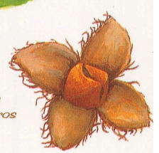
Cúpula abierta con frutos maduros