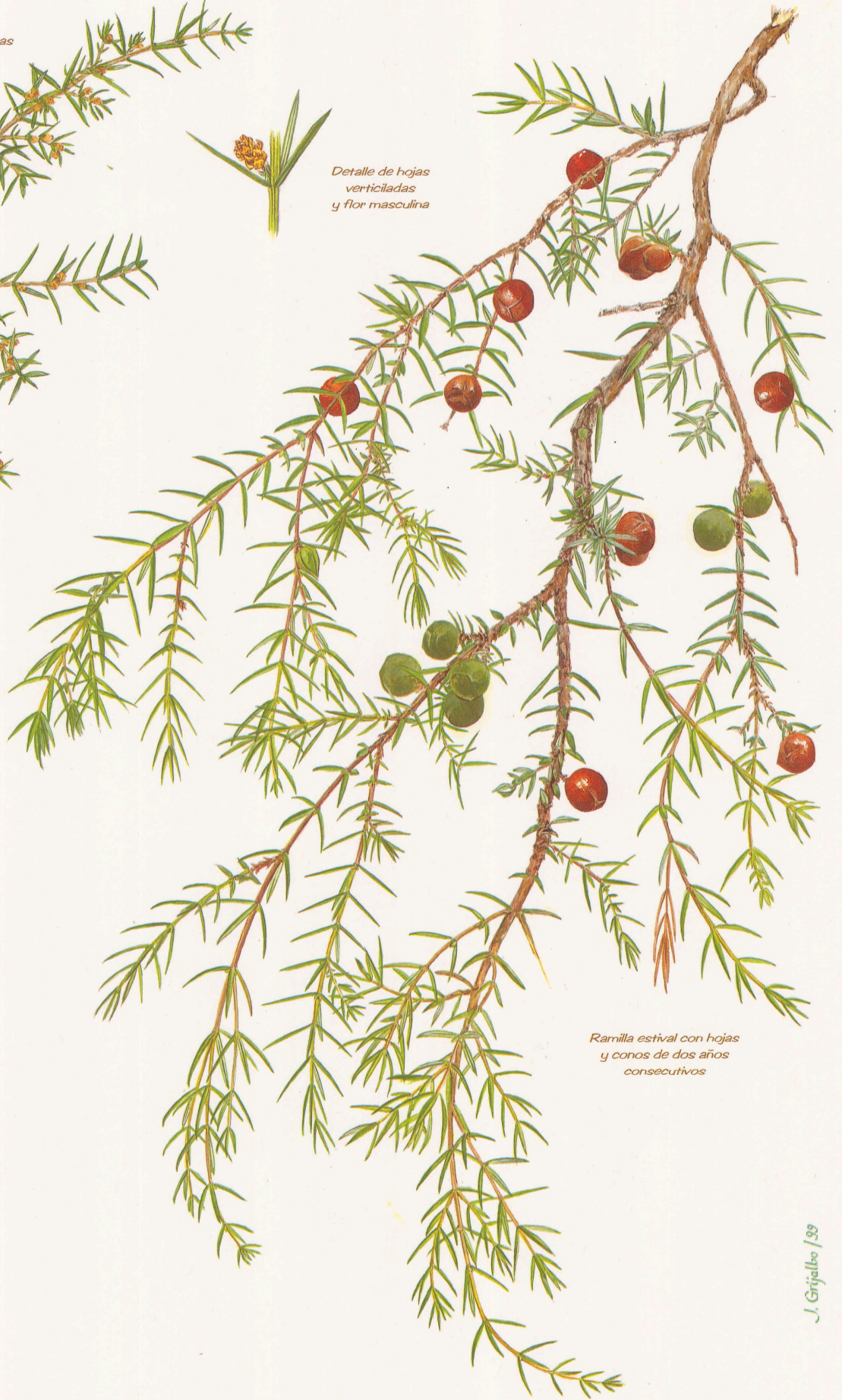
Ramilla estival con hojas y conos de dos años consecutivos