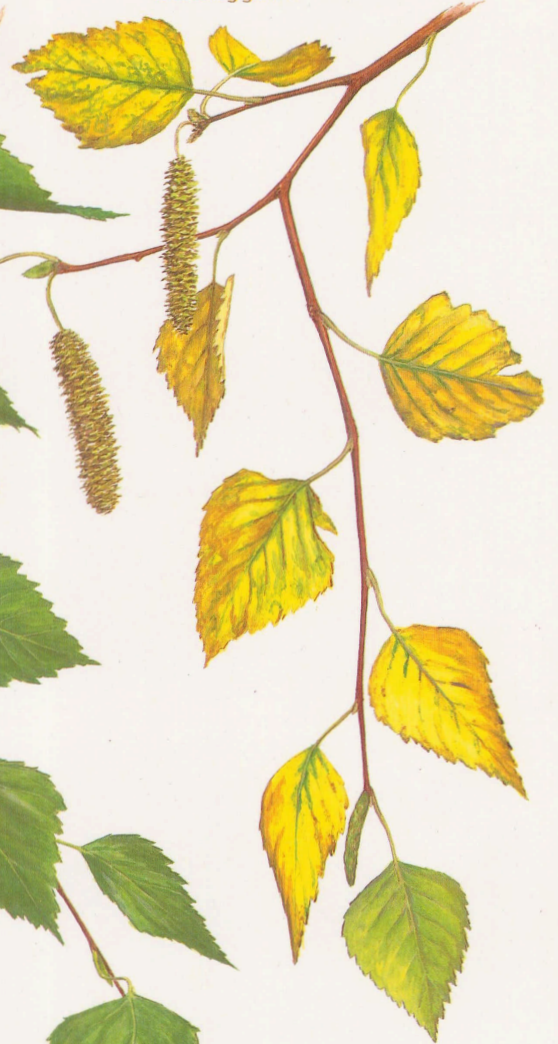
Ramilla otoñal con fructificaciones maduras y yemas