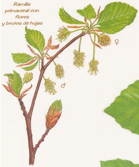
Ramilla primaveral con flores y brotes de hojas