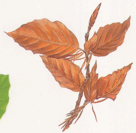
Ramilla invernal de ejemplar joven con hojas marcescentes