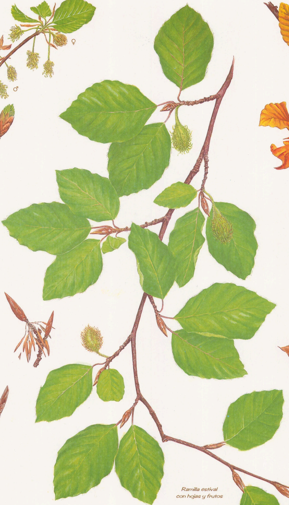
Ramilla estival con hojas y frutos