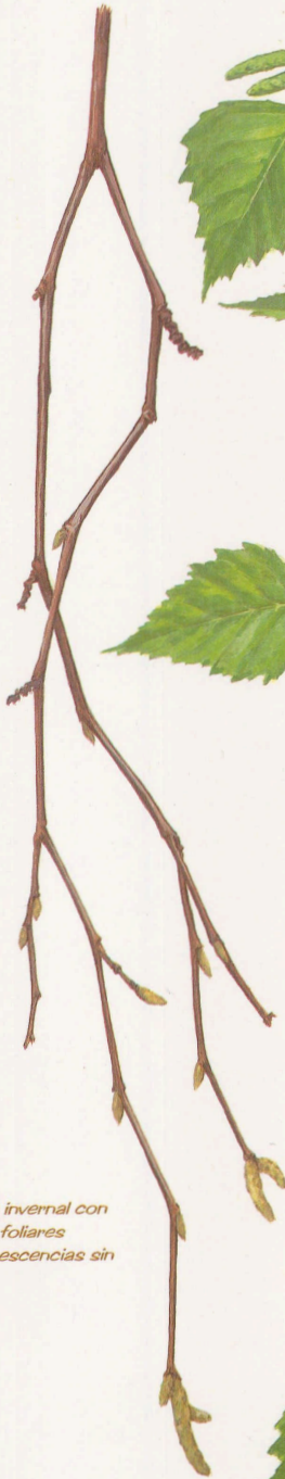
Ramilla invernal con yemas foliares e inflorescencias sin abrir