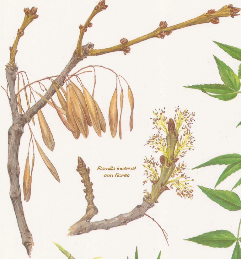
Ramilla invernal con flores