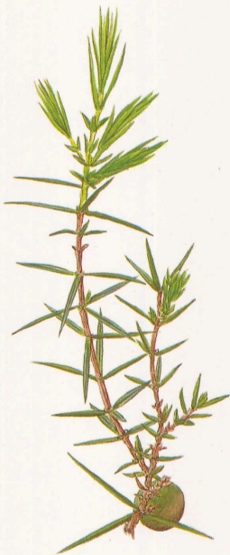
Ramilla invernal con brotes de hojas en un ejemplar femenino