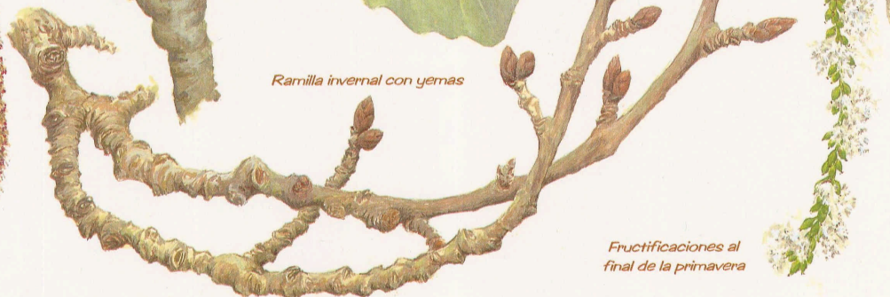
Fructificaciones al final de la primavera