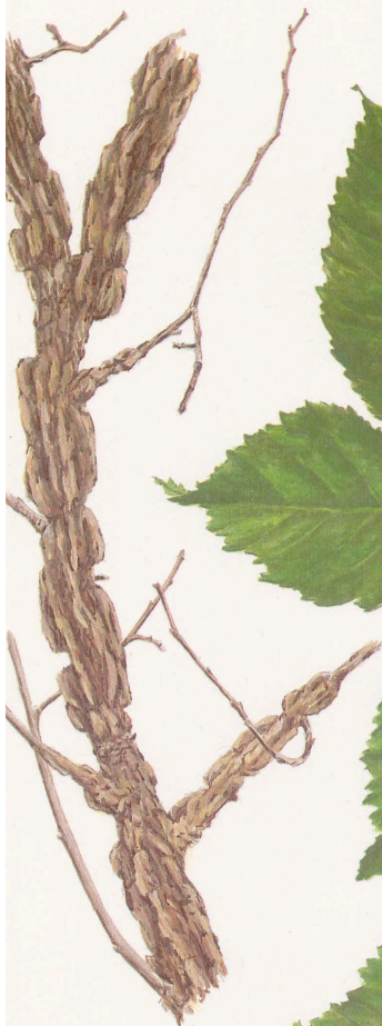
Ramilla invernal con costillas suberosas