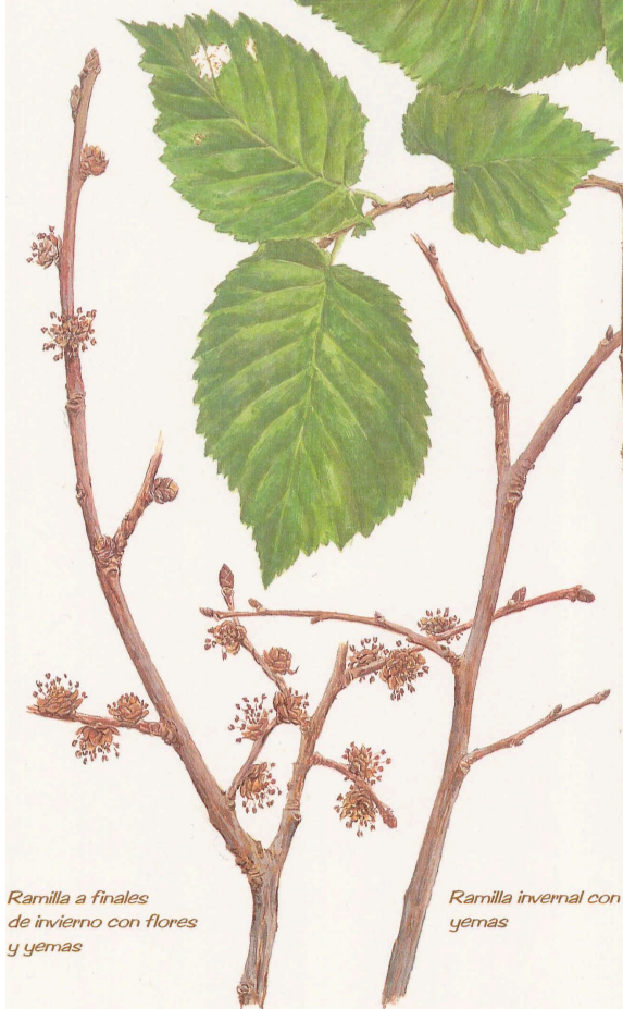
Ramilla a finales de invierno con flores y yemas