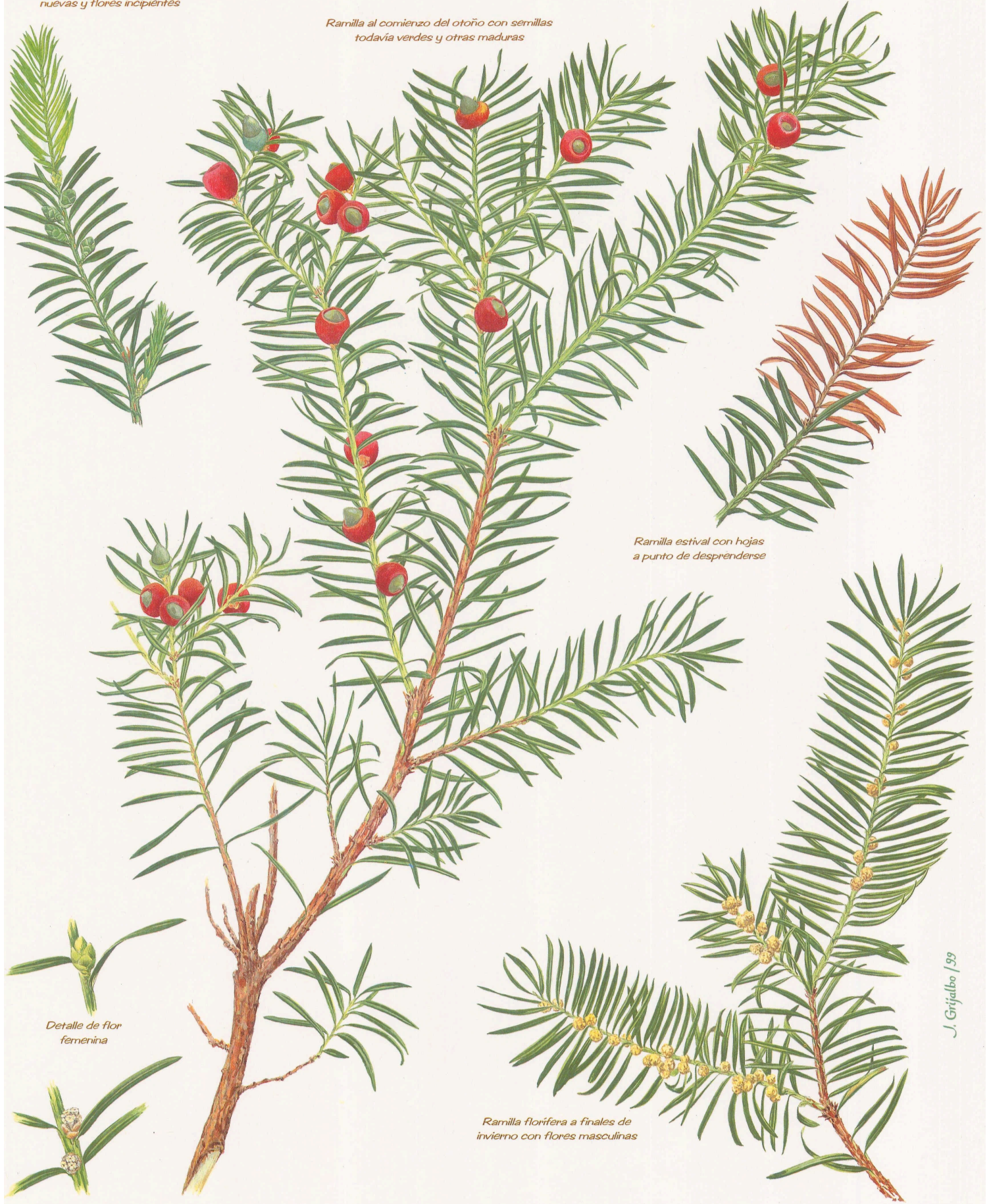
Ramilla estival con hojas a punto de desprenderse