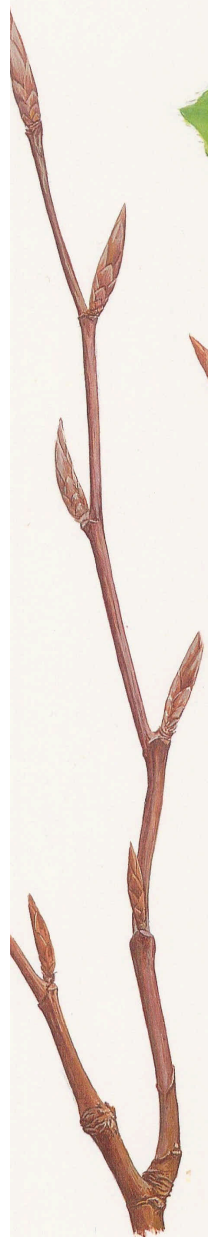
Ramilla invernal con yemas foliares