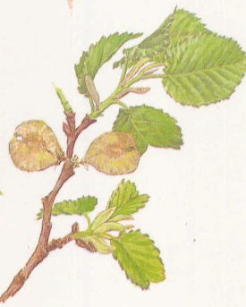
Ramilla primaveral con hojas jóvenes y frutos maduros