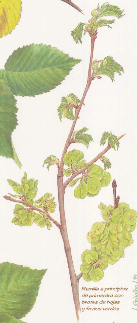
Ramilla a principios de primavera con brotes de hojas y frutos verdes