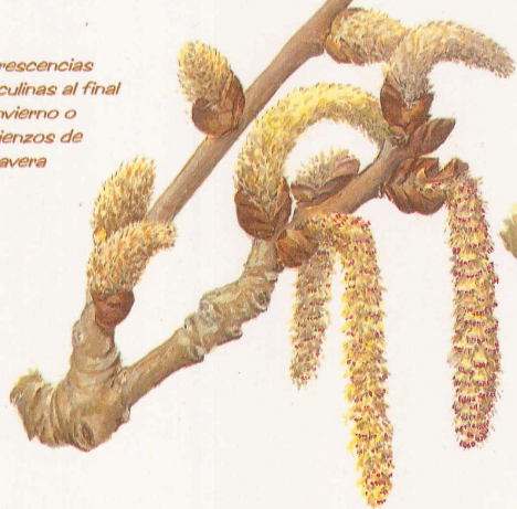
Inflorescencias masculinas al final del invierno o comienzos de primavera