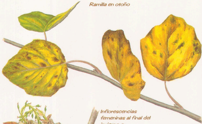
Ramilla en otoño