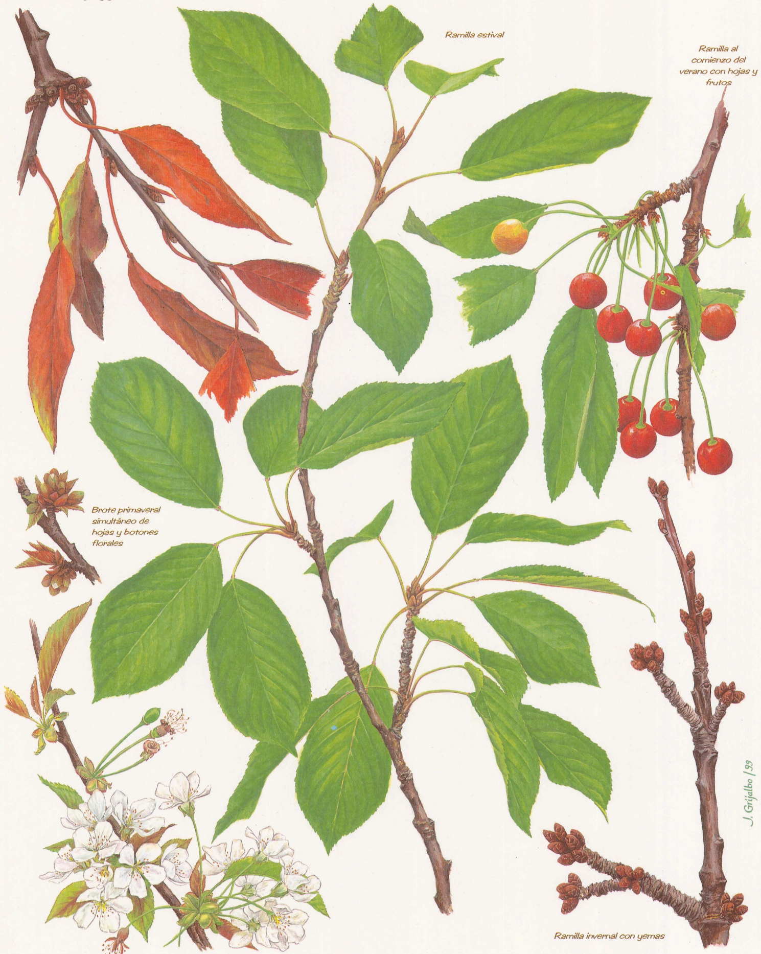
Brote primaveral simultáneo de hojas y botones florales