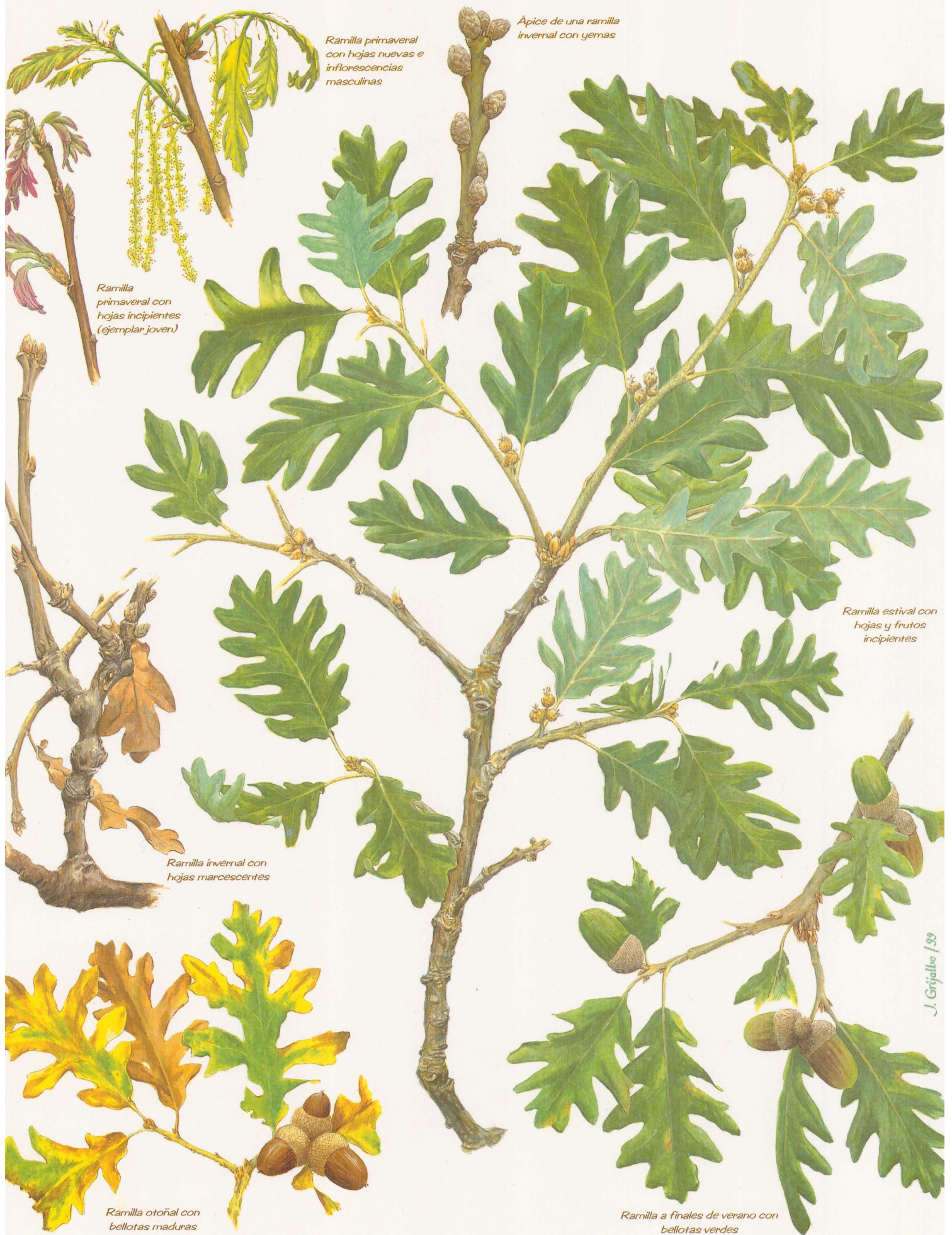
Ramilla primaveral con hojas nuevas e inflorescencias masculinas