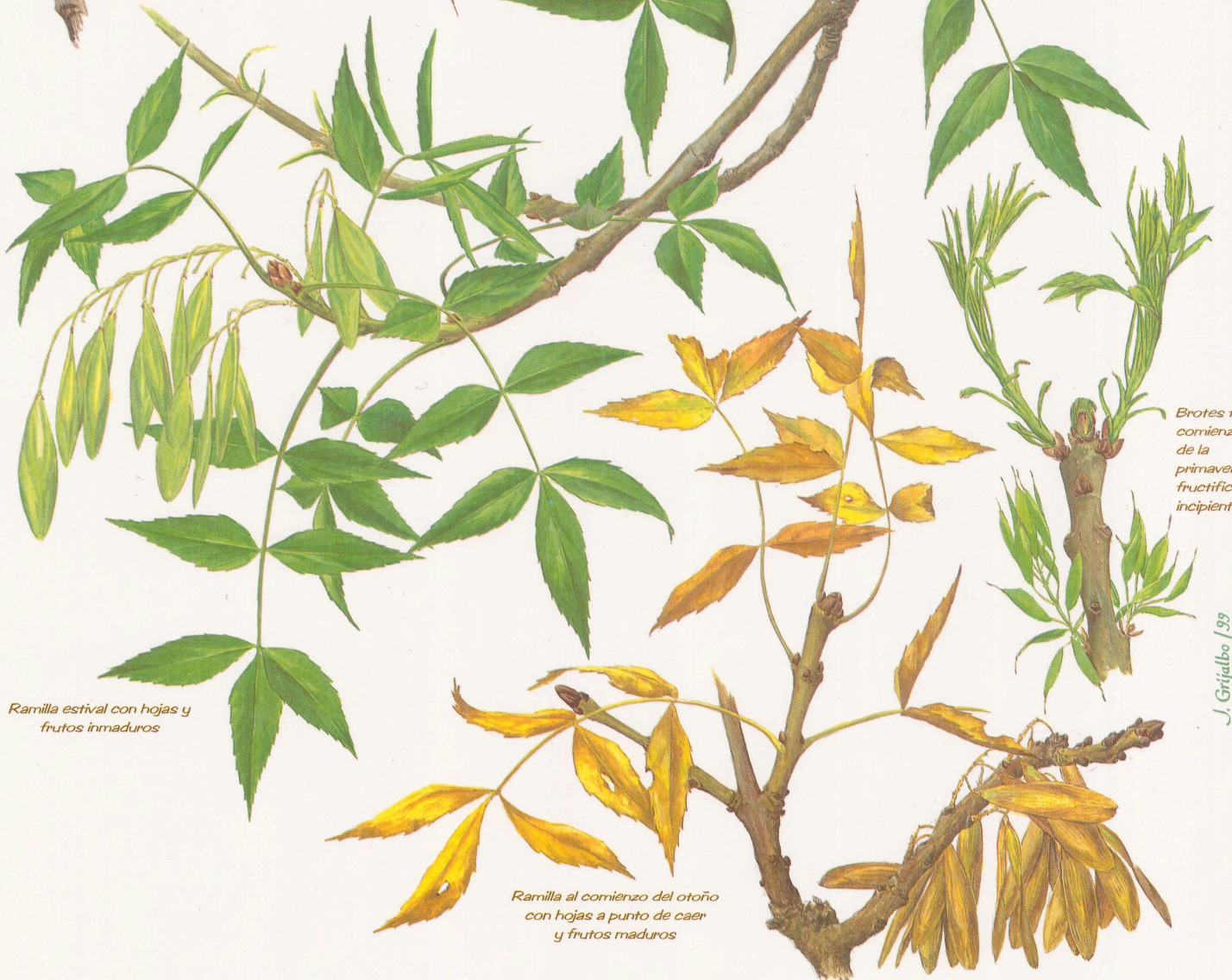
Ramilla estival con hojas y frutos inmaduros