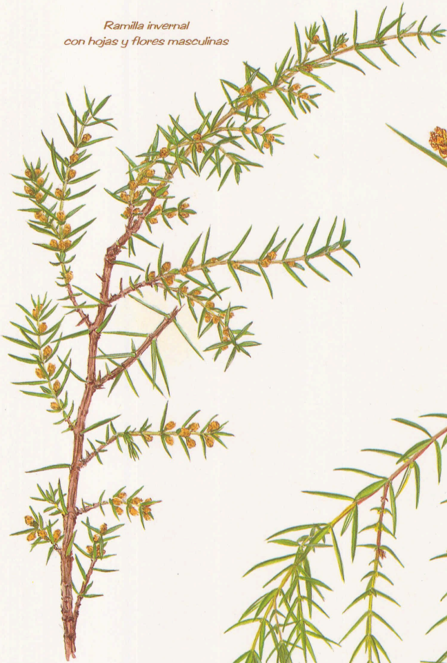
Ramilla invernal con hojas y flores masculinas