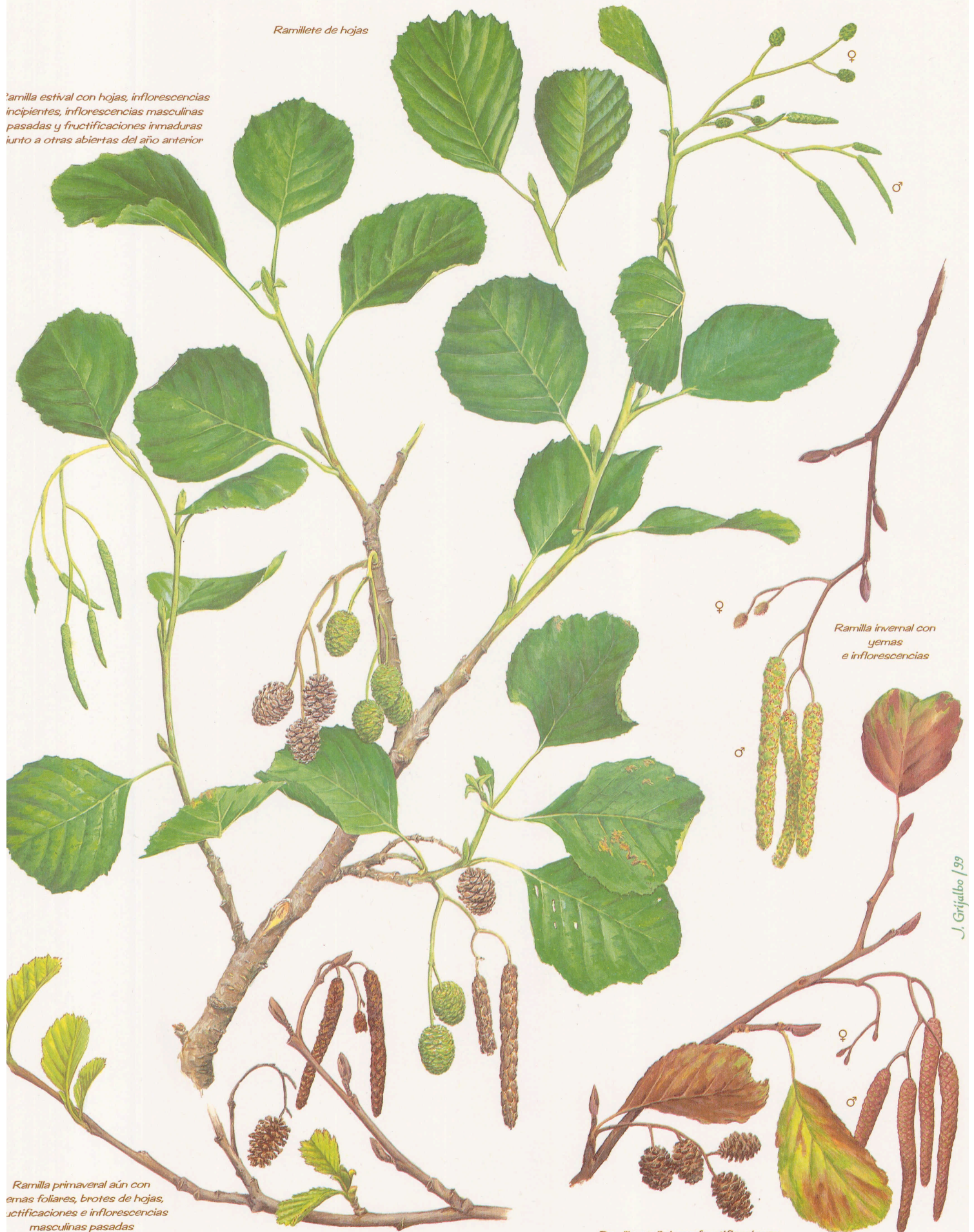
Ramilla invernal con yemas e inflorescencias