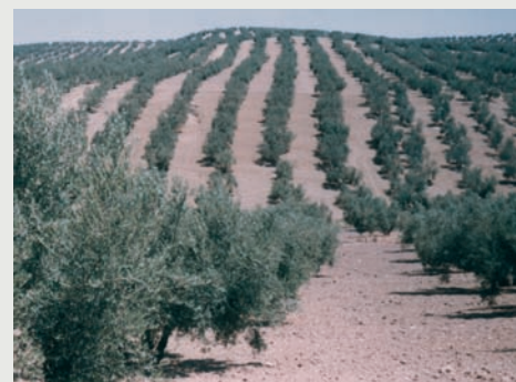
Figura 4: Cuando la pendiente supere el 15% no se deberá labrar el suelo del olivar