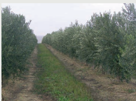
Figura 5: Olivar con cubierta vegetal entre líneas, ejemplo de laboreo de conservación

Labrar: Alterar y remover el suelo por medios mecánicos con una profundidad mayor o igual de 20 centímetros