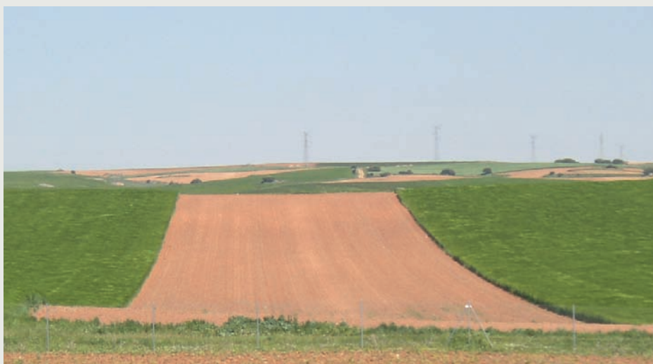
Figura 2: Terreno cultivado a favor de pendiente que no se debería labrar si ésta supera el 10%