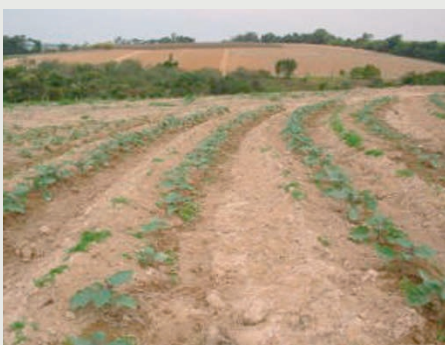
Figura 3: Cultivo siguiendo las curvas de nivel para minimizar la erosión del suelo