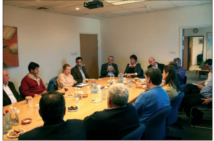
La delegación de Madrid fue recibida por la ministra de Agricultura israelí ▲

Finalmente, del 25 de febrero al 1 de marzo, una delegación encabezada por el director general de Agricultura y Desarrollo Rural visitó en Israel diferentes ejemplos reales de soluciones de riego con agua regenerada en granjas agrícolas y ganaderas, así como empresas punteras en tecnologías de irrigación.