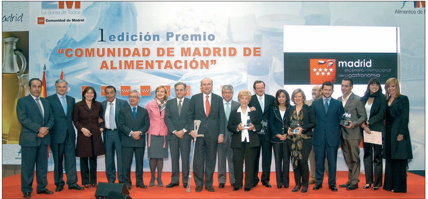
▲ Foto de grupo de los premiados en la I Edición del Premio Comunidad de Madrid de Alimentación