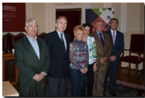
PARTE DE LA REPRESENTACIÓN DEL CONSEJO ESCOLAR DE LA COMUNIDAD DE MADRID QUE ASISTIÓ A LOS ENCUENTROS