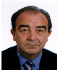
Presentación del Presidente