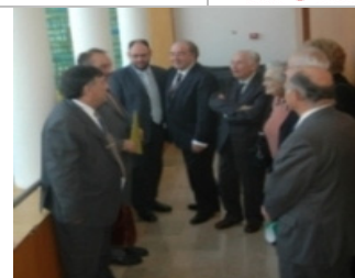
XVI Encuentro de Consejos Escolares

El Consejo Escolar de la Comunidad de Madrid, en su empeño por mejorar la calidad de la participación en el seno de la comunidad educativa madrileña, dirige sus esfuerzos a promover actuaciones y espacios que faciliten la comunicación, la reflexión y el entendimiento entre todos los agentes educativos y las distintas organizaciones e instituciones que contribuyen al buen rumbo de la educación en nuestra región.