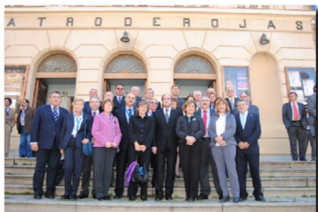
LOS PRESIDENTES DE LOS CONSEJOS ESCOLARES AUTONÓMICOS Y DEL ESTADO JUNTO CON EL MINISTRO DE EDUCACIÓN