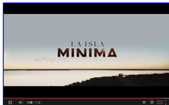
LA ISLA MINIMA , de Alberto Rodríguez Atresmedia Cine / Sacromonte Films / Atípica Films