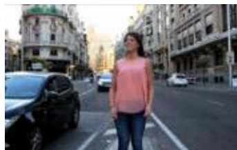
ÉRASE UNA VEZ...MADRID Dirección: Inés Álvarez Pérez