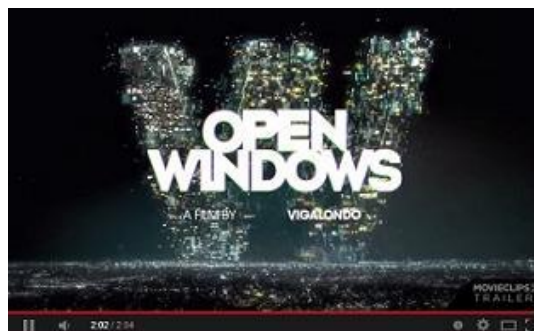
OPEN WINDOWS , de Nacho Vigalondo

Wild Bunch / Apaches Entertainment / Antena 3 / Woodshed / EITB / Canal +