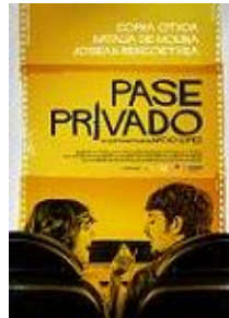
PASE PRIVADO Dirección y guion: Natxo López Producción: Lamia Producciones

Telemadrid / La Otra colabora con la Semana del Cortometraje de la Comunidad de Madrid concediendo un primer premio dotado de 6.000 € y cinco premios de 4.000 € para contribuir a la difusión del cortometraje a través de la televisión regional.