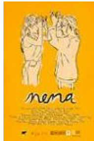
NENA Dirección y guion: Alauda Ruiz de Azúa Producción: Encanta Films