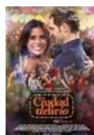
CIUDAD DELIRIO Director: Chus Gutiérrez Fatal Film (en coproducción)