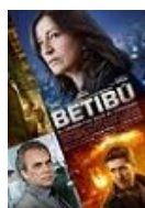
BETIBÚ Director: Miguel Cohan Tornasol Films (en coproducción)