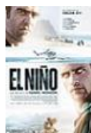
EL NIÑO Director: Daniel Monzón Telecinco Cinema y El Toro Pictures (en coproducción)