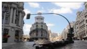
HAY UN SITIO PARA TI Dirección: Álvaro Belbel Ruiz

Dotación: Los concursantes optan al Primer Premio del Jurado (1.000 €) y al Segundo Premio (500 €).