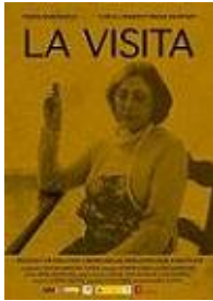
LA VISITA Dirección y guion: Carmen Bellas Producción: Amigo Films