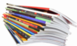
Hemeroteca (consulta de diarios y revistas)

Servicios: El carné de la biblioteca es gratuito , así como los servicios que ofrece la Biblioteca: