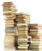
Reservas y petición personalizada de libros