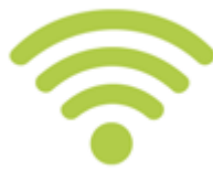
Internet y wifi