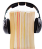
Préstamo libros, películas, música, revistas...