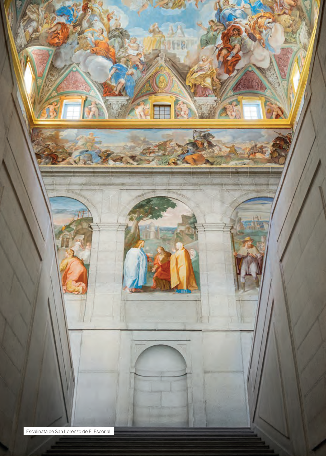
Escalinata de San Lorenzo de El Escorial