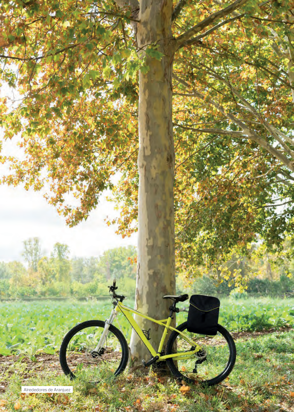
Alrededores de Aranjuez