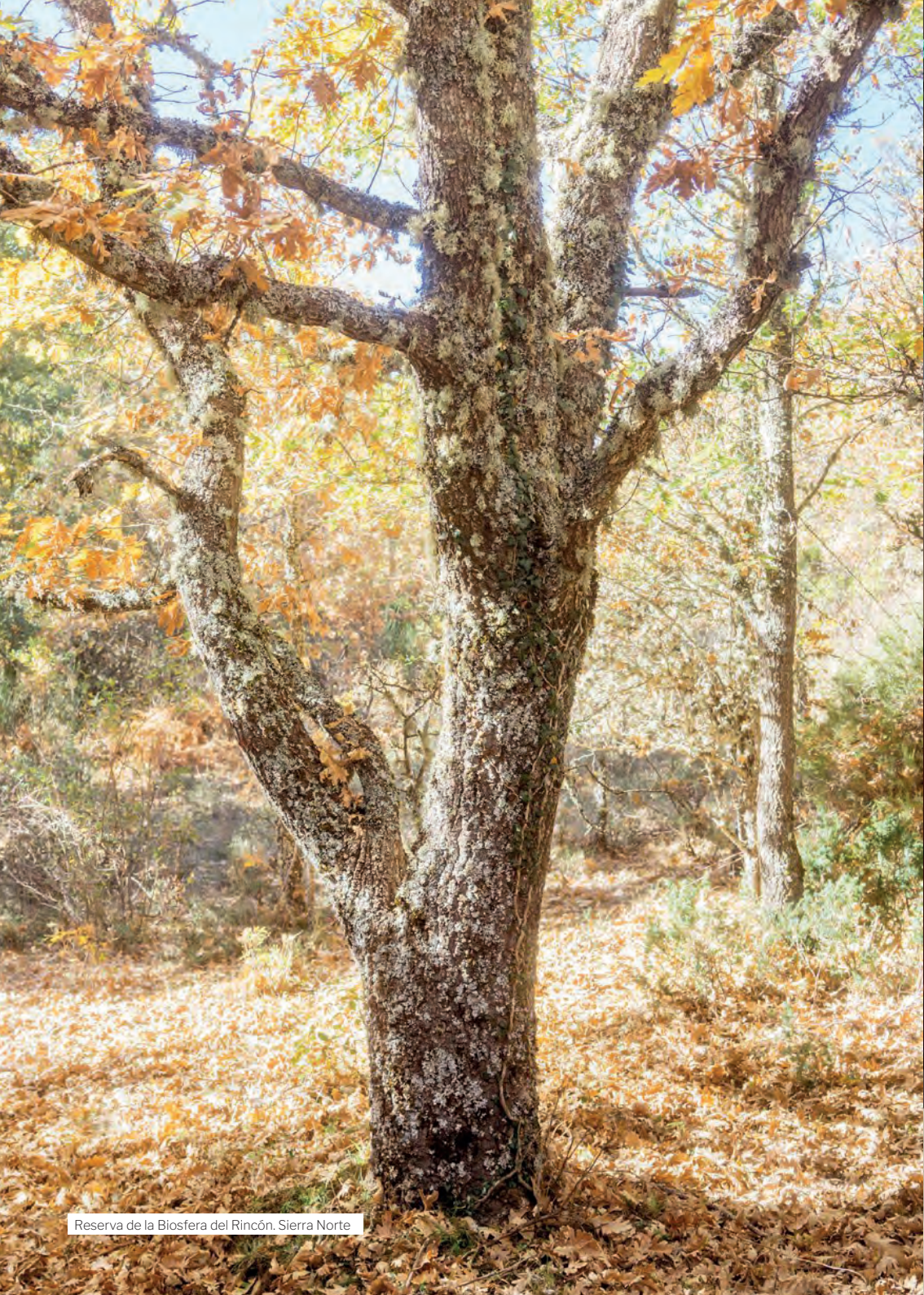
Reserva de la Biosfera del Rincón, Sierra Norte