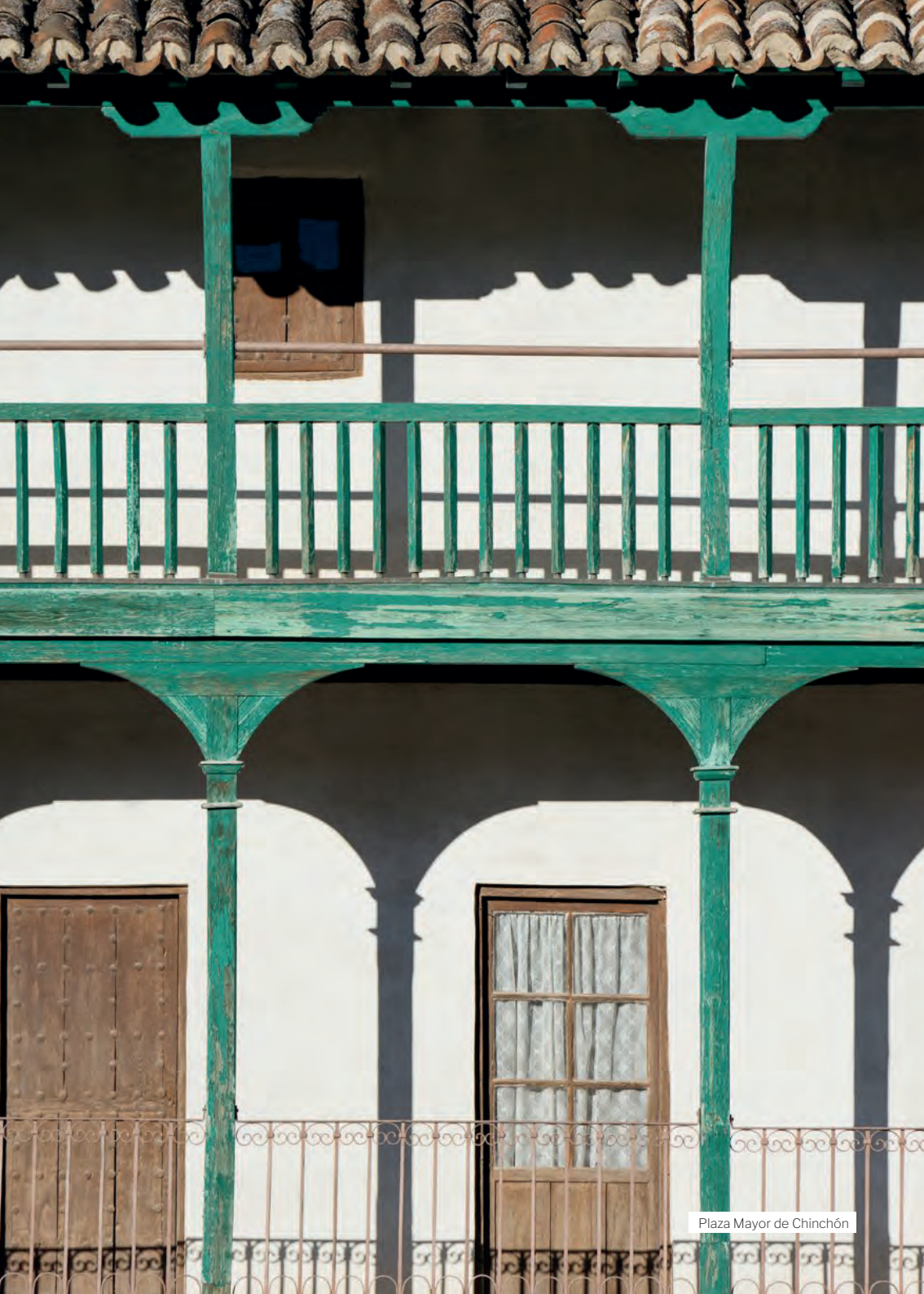
Plaza Mayor de Chinchón