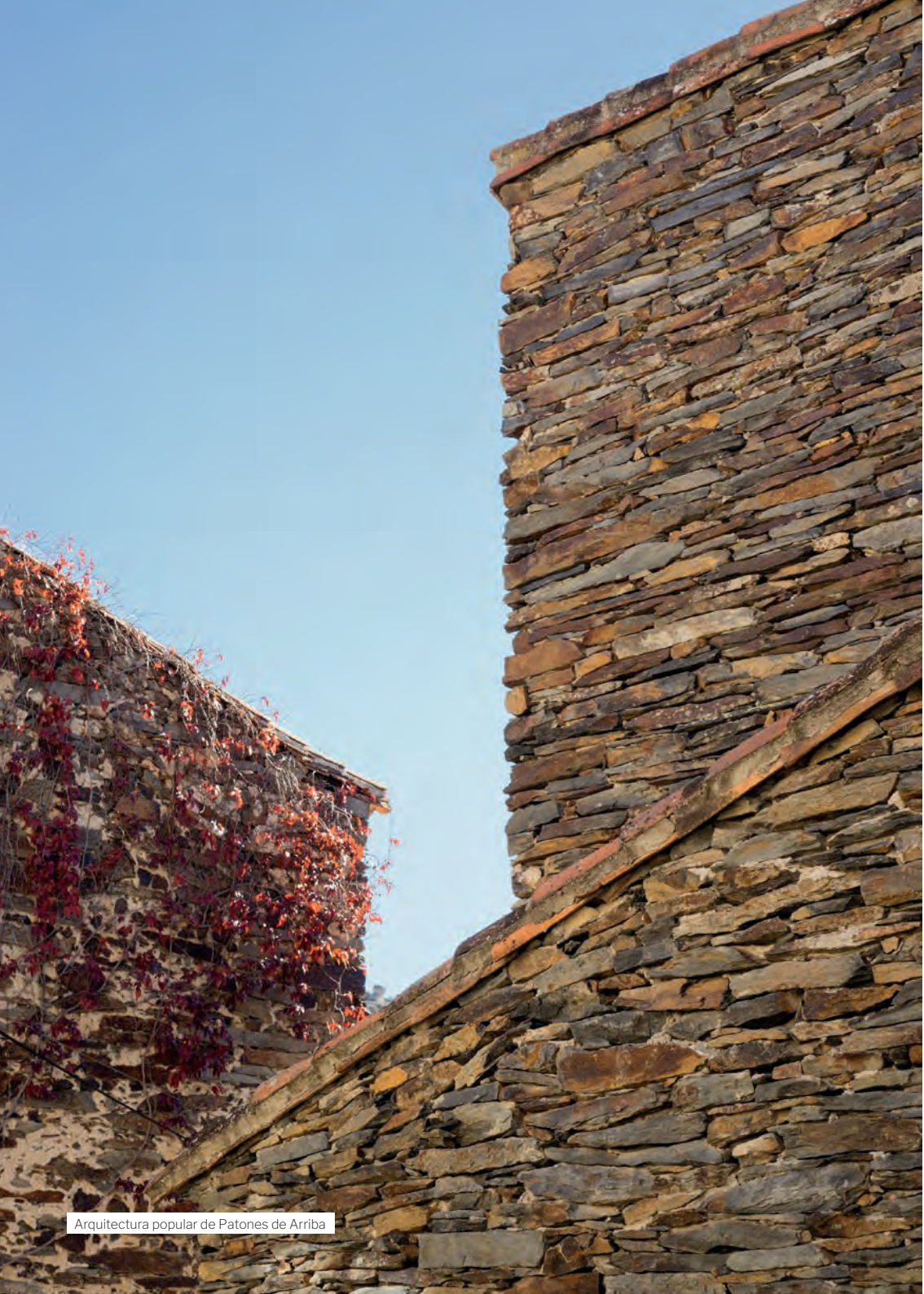
Arquitectura popular de Patones de Arriba