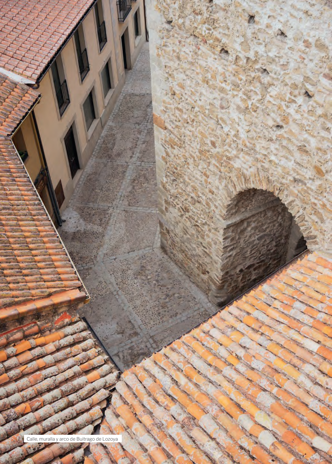
Calle, muralla y arco de Buitrago de Lozoya