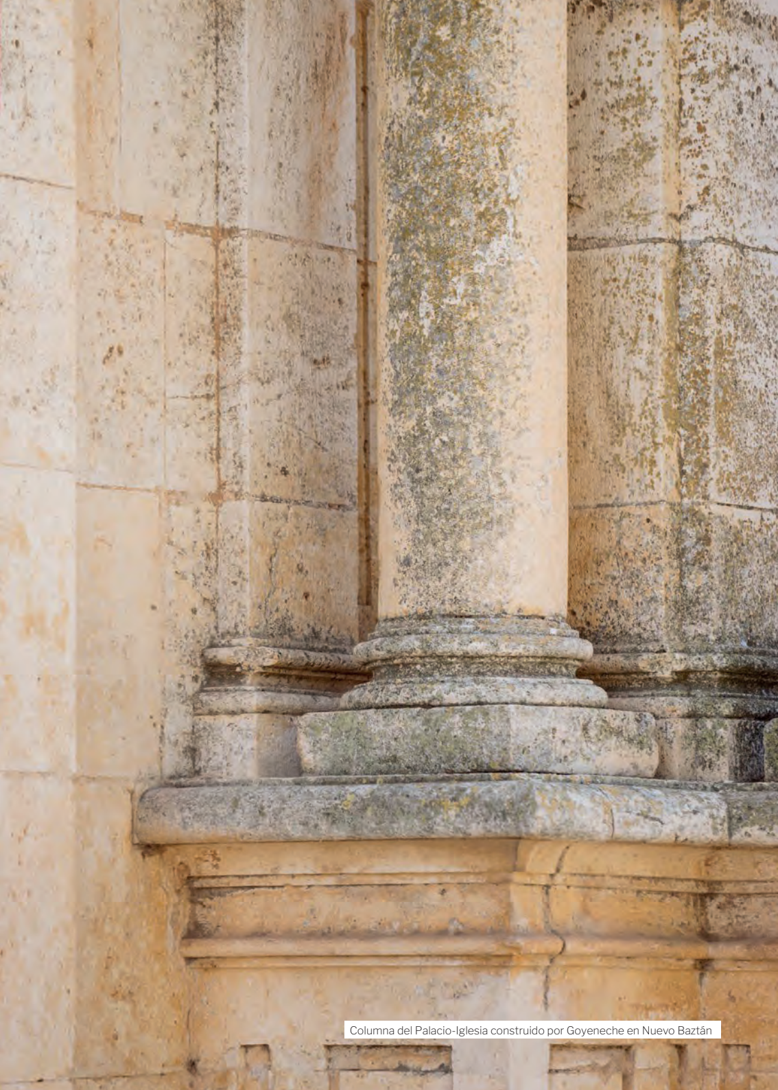
Columna del Palacio-Iglesia construido por Goyeneche en Nuevo Baztán