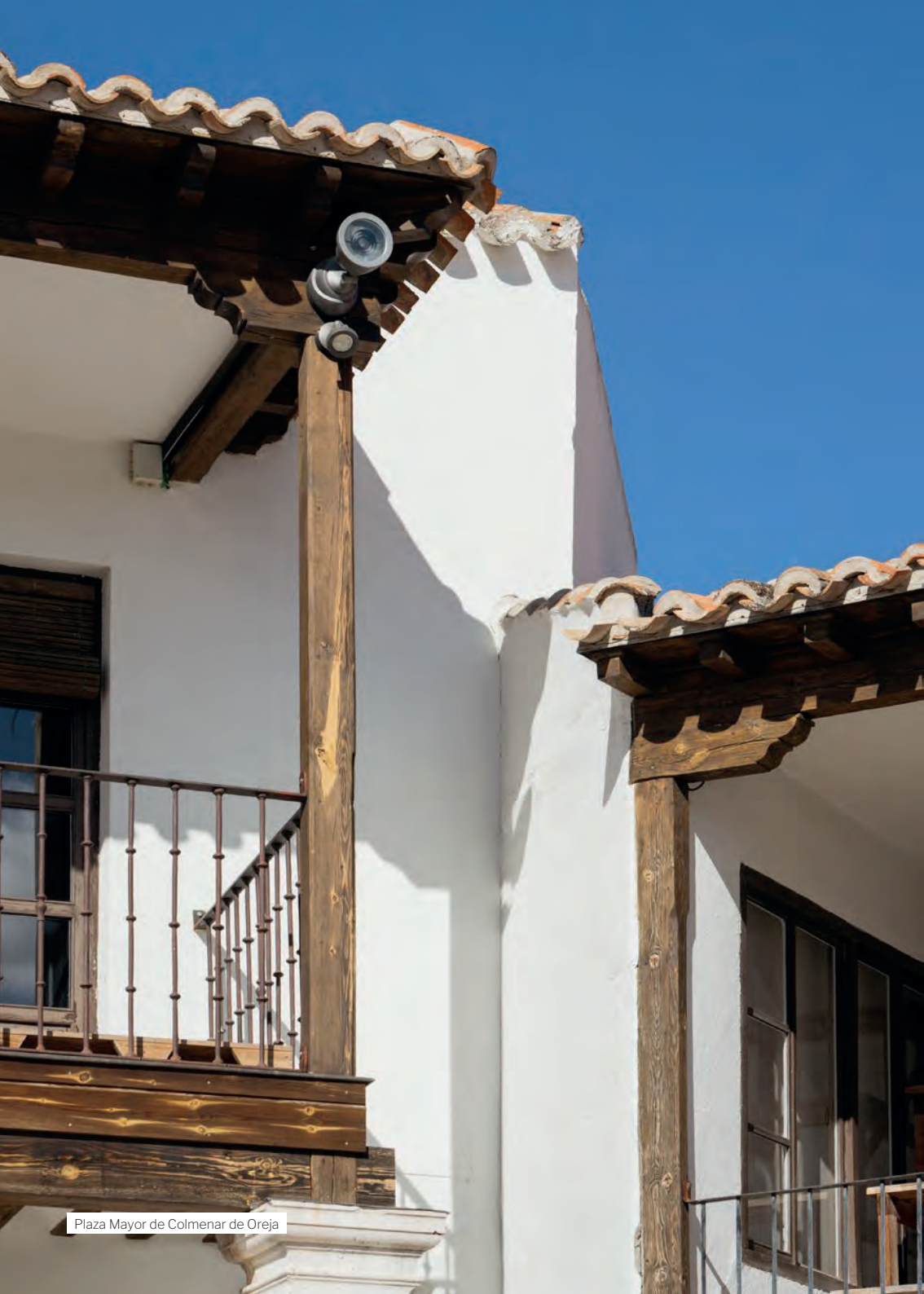
Plaza Mayor de Colmenar de Oreja