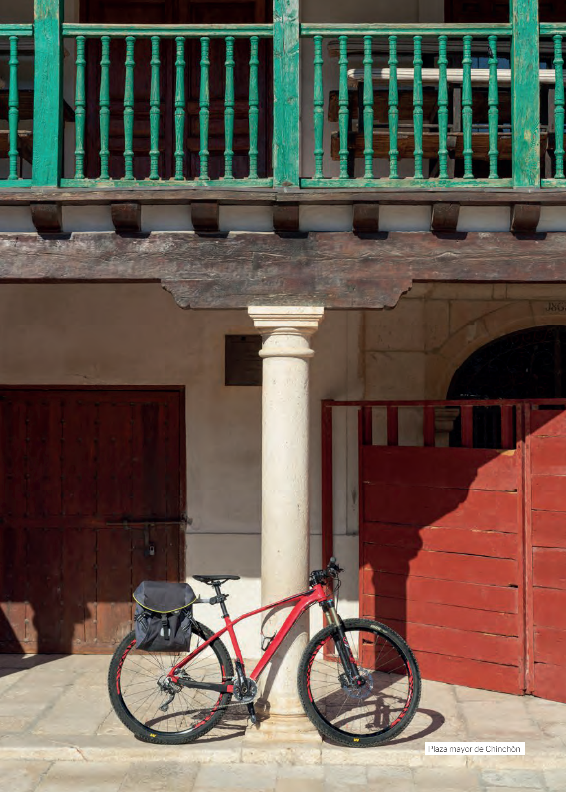
Plaza mayor de Chinchón