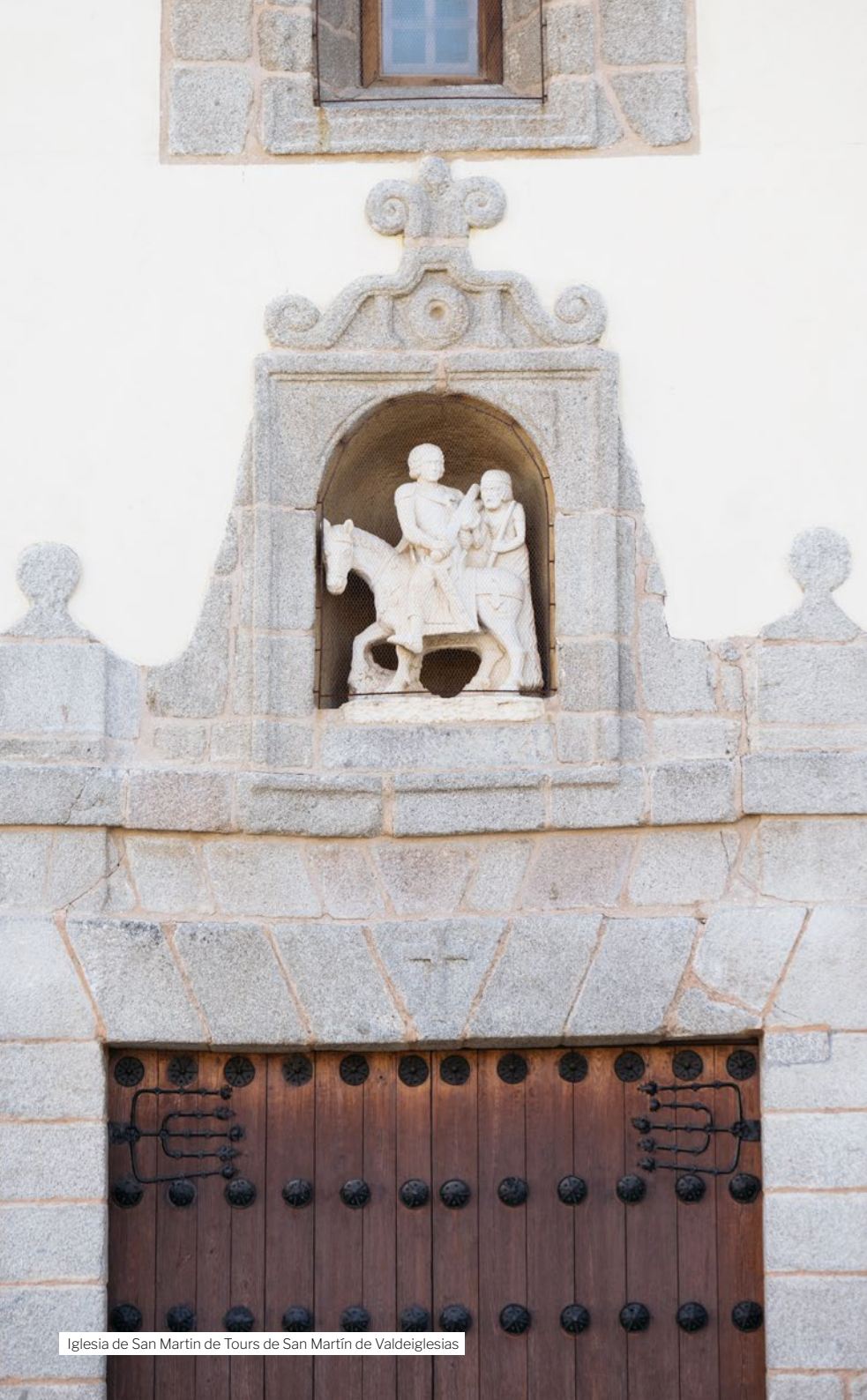
Iglesia de San Martín de Tours de San Martín de Valdeiglesias