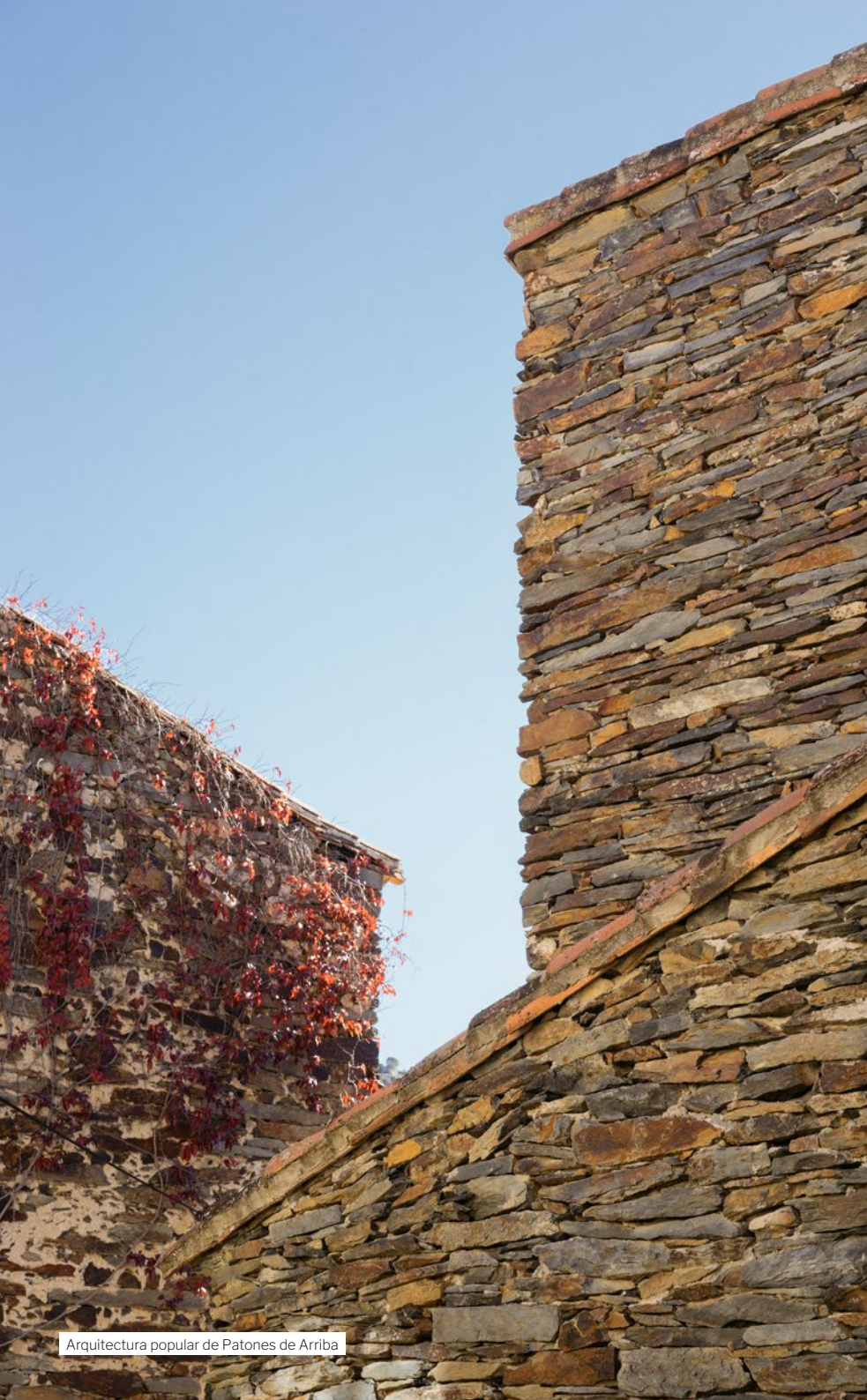
Arquitectura popular de Patones de Arriba