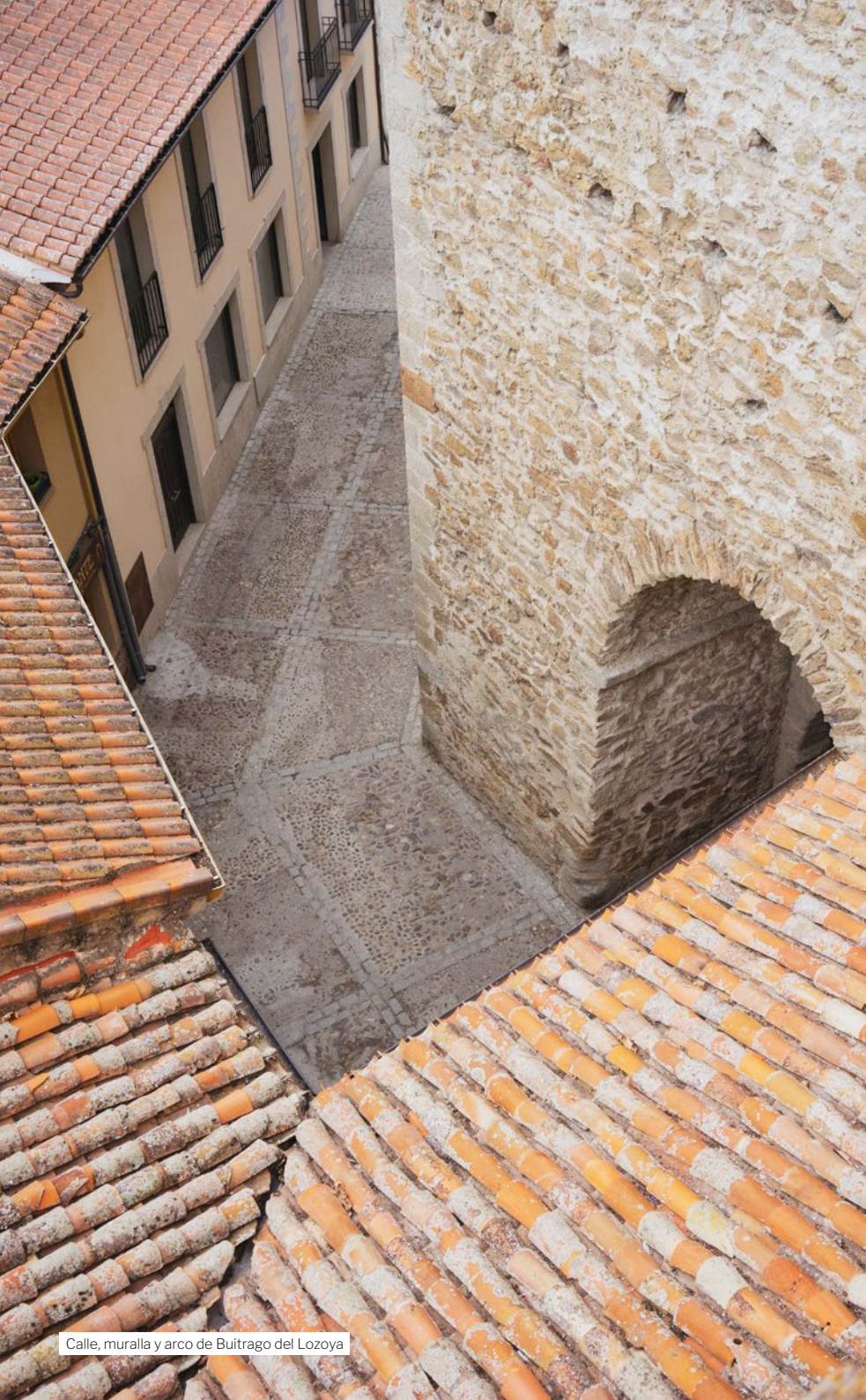
Calle, muralla y arco de Buitrago del Lozoya