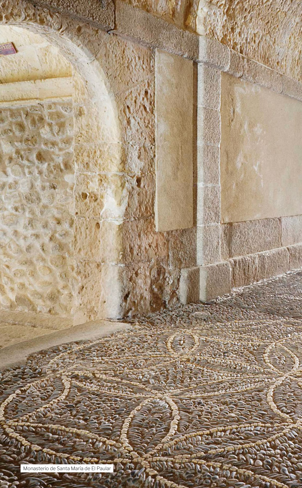
Monasterio de Santa María de El Paular