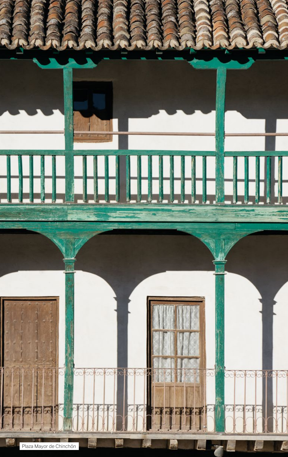
Plaza Mayor de Chinchón