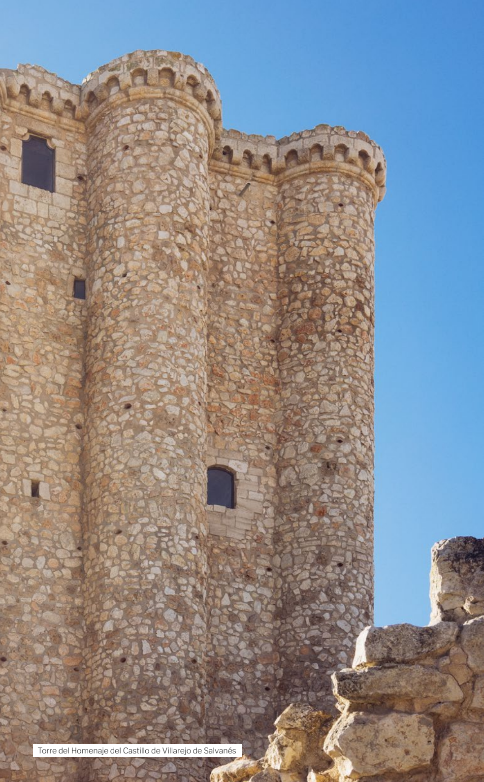
Torre del Homenaje del Castillo de Villarejo de Salvanés