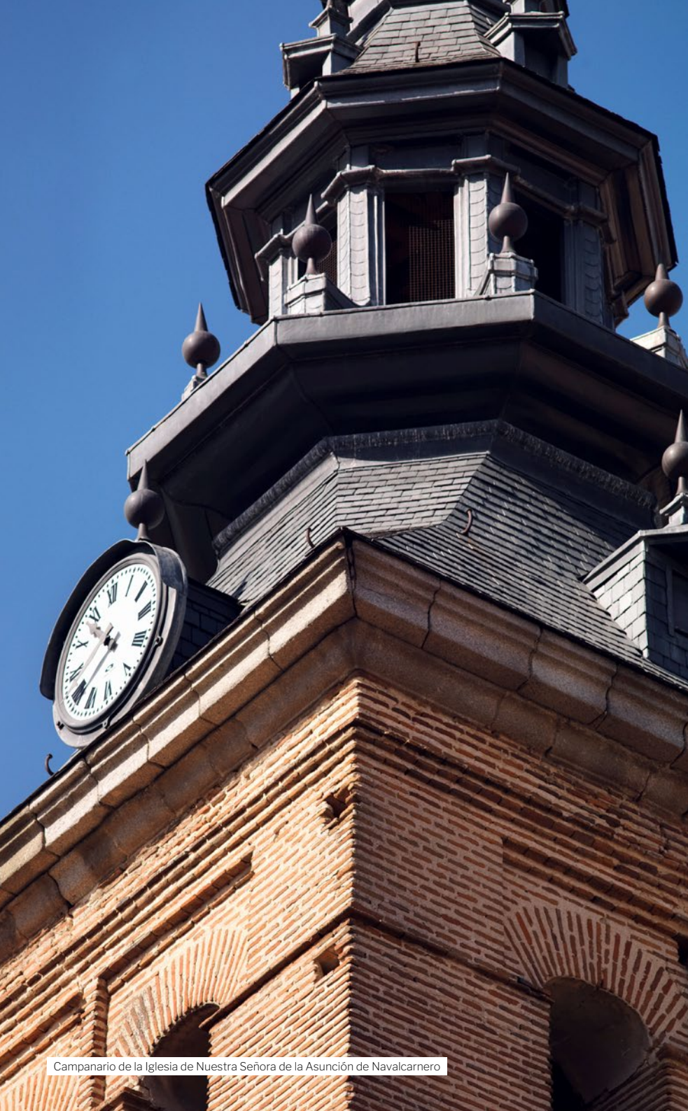
Campanario de la Iglesia de Nuestra Señora de la Asunción de Navalcarnero