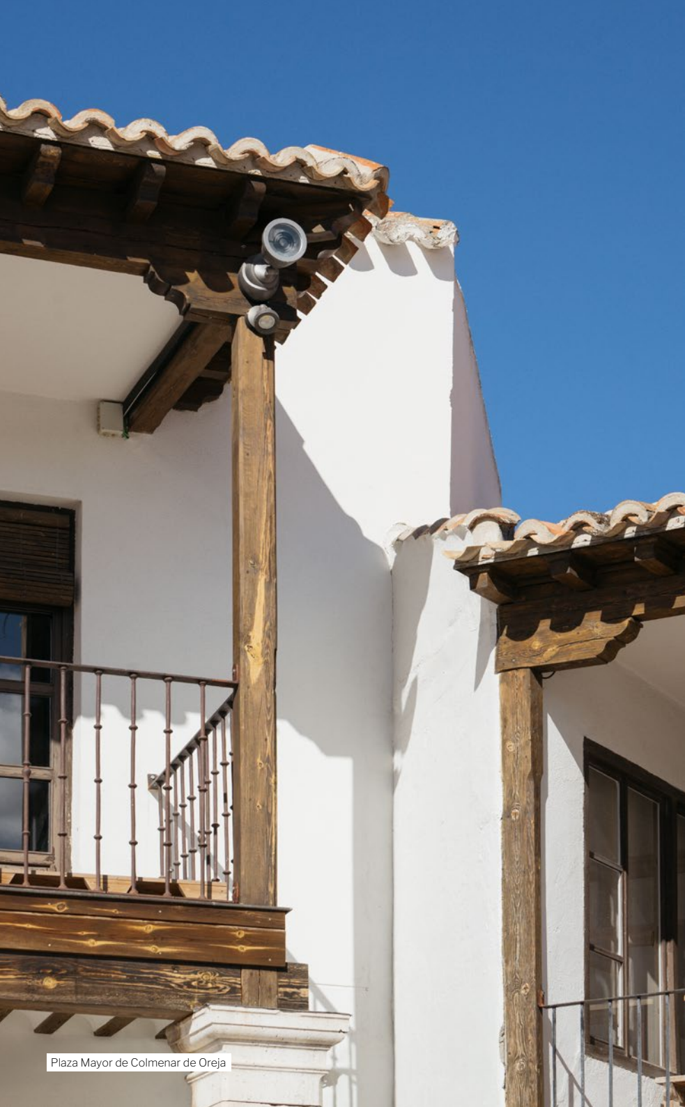
Plaza Mayor de Colmenar de Oreja