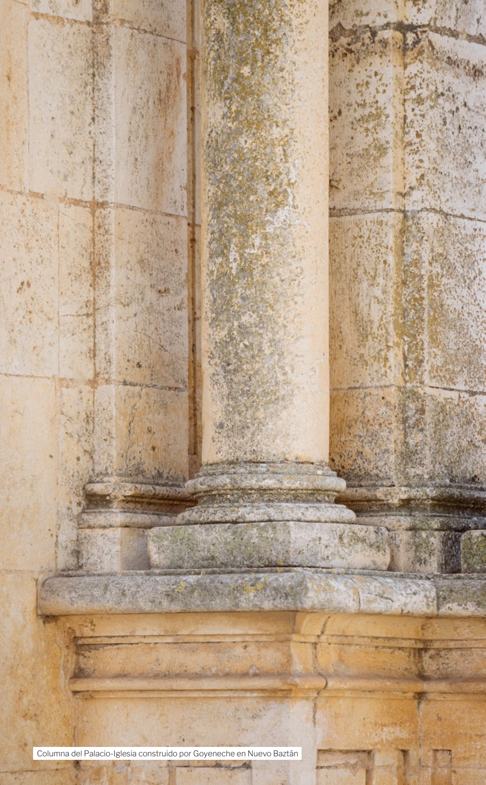
Columna del Palacio-Iglesia construido por Goyeneche en Nuevo Baztán