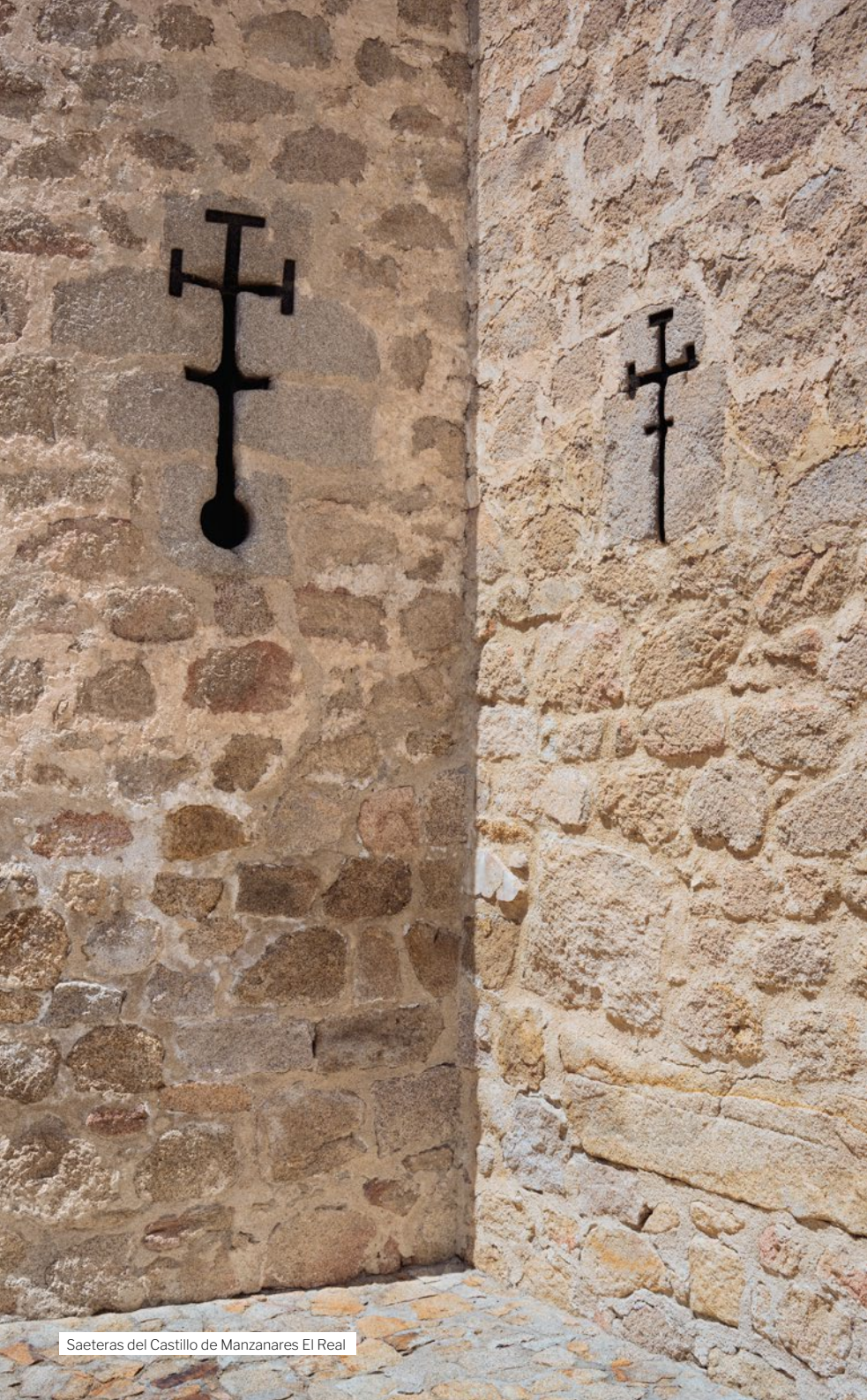
Saeteras del Castillo de Manzanares El Real