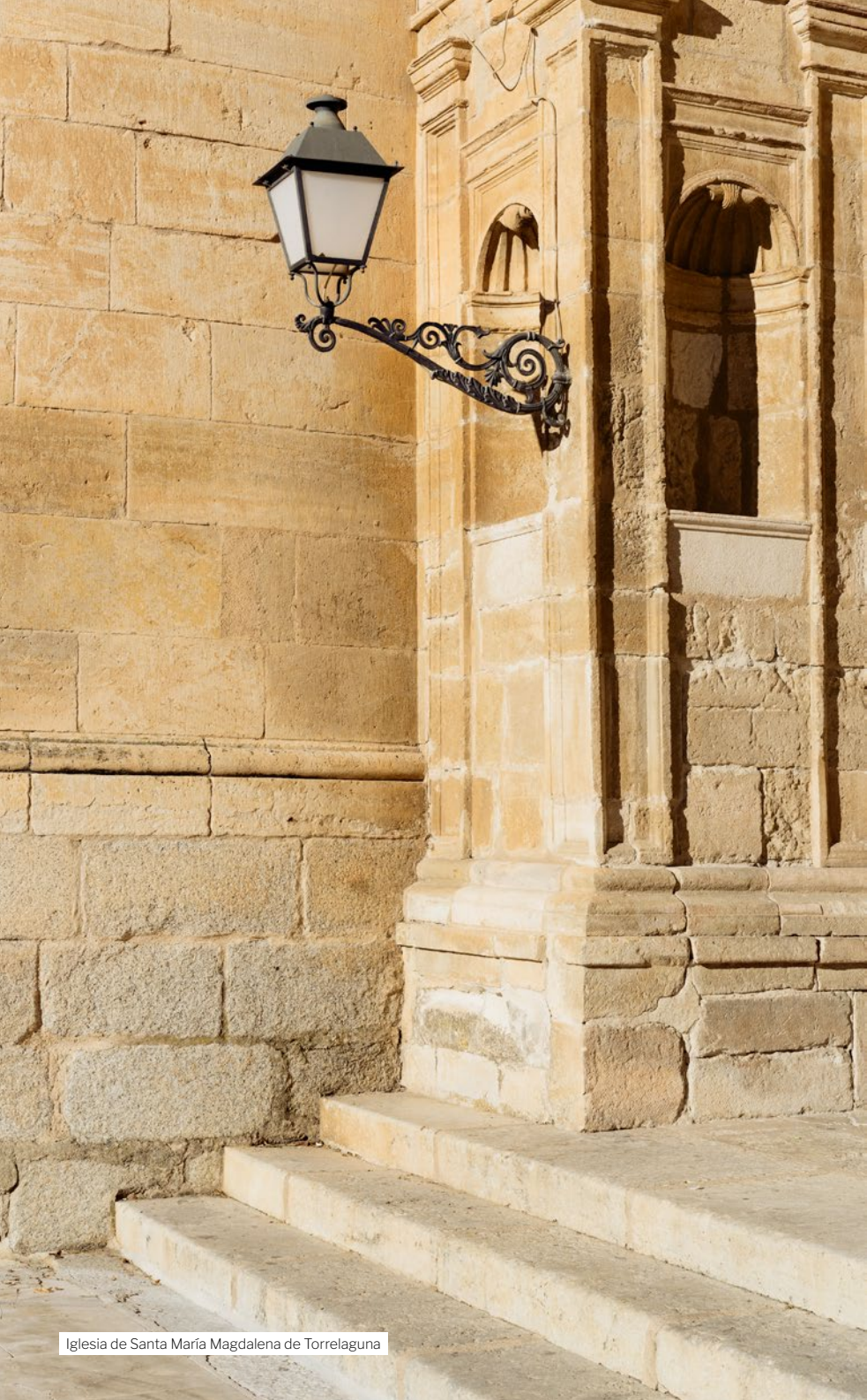
Iglesia de Santa María Magdalena de Torrelaguna