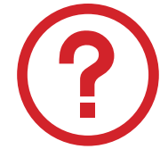
Información y consulta