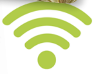
Wifi Internet y multimedia