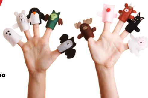
Espacios para el estudio y la lectura