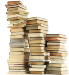
Reservas y petición personalizada de libros