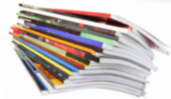
Hemeroteca (lectura de diarios y revistas)