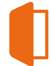
eBiblio (préstamo de libros digitales)