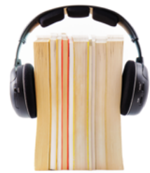
Préstamo (libros, películas, música, revistas, audiolibros...)