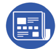
Quiosco digital (acceso en línea de diarios y revistas)