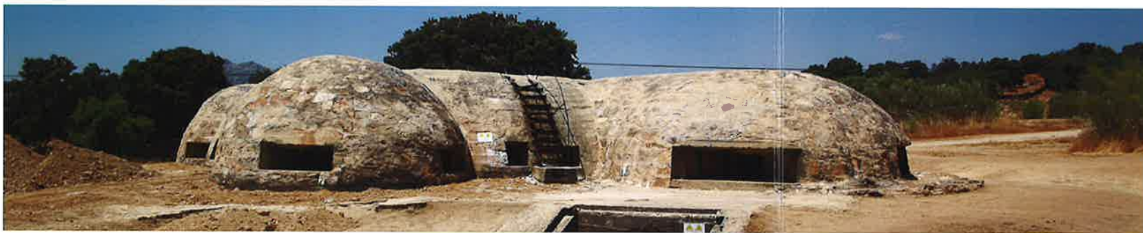
Blockhaus 13 (Colmenar del Arroyo)

Paralelamente se han desarrollado diversas actuaciones en enclaves significativos de la época para facilitar las visitas, como es el caso, entre otras, de las rutas