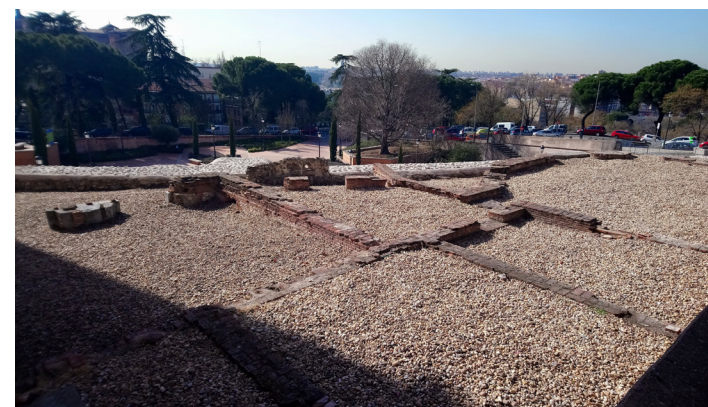
Fig. 5 Restos de las estructuras levantadas entre los siglos XVII y XIX sobre la muralla islámica en el Parque del Emir Mohammed I