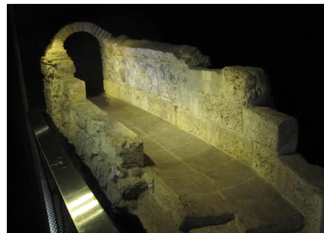
Fig. 13 Restos de la Alcantarilla del Arenal