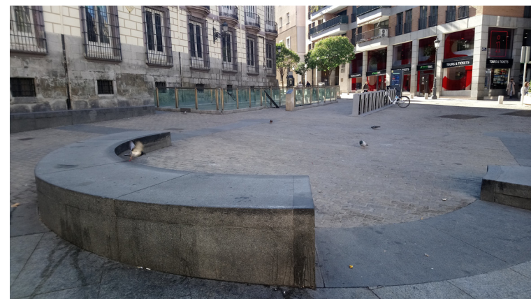
Fig. 9 Restos arqueológicos de la iglesia de San Juan Bautista en la Plaza de Ramales

La iglesia de San Juan Bautista es una de los templos mencionados en el Fuero de Madrid, aunque posiblemente fue reedificada en 1254. A partir del siglo XV se levantaron varias capillas y a mediados del siglo XVII fue ampliada. Entre 1810 y 1811 fue demolida por José Bonaparte , el hermano de Napoleón, enviado a España para ser el nuevo rey en sustitución de los Borbones. José I quería transformar Madrid y abrir plazas en algunos puntos para que hubiese más espacio y aligerar así el trazado urbano de la villa, con demasiadas calles estrechas. Por este motivo, en Madrid se le conocía con el apelativo de “el rey plazuela” . Para crear el espacio abierto de la Plaza de Ramales ordena derribar la iglesia de San Juan Bautista.