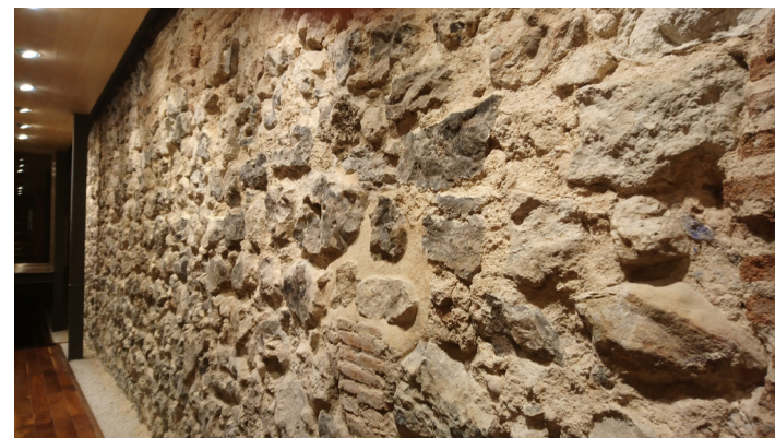
Fig. 21 Restos arqueológicos de la muralla medieval cristiana en la calle del Almendro

Del trazado urbano y organización espacial de la morería de Madrid sólo quedan algunos topónimos (Puerta de Moros, Calle de la Morería, Plaza del Alamillo, etc.) y alguna información sobre la existencia de un zoco, baños, una casa de bodas y una carnicería. En lo que se refiere a sus evidencias arqueológicas, los restos documentados en este sector anteriores a la Baja Edad Media son básicamente silos-basureros . A partir de ese momento, comienzan a observarse una densificación de las construcciones y el acondicionamiento del terreno con suelos y empedrados.