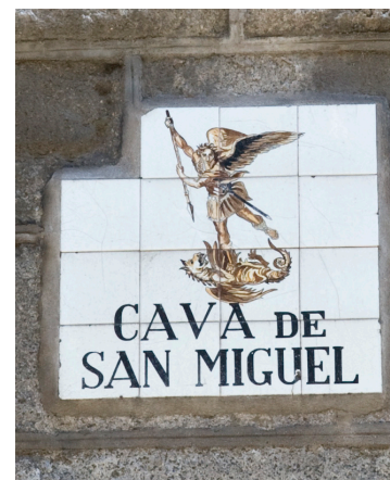
Fig. 18 Placa con el nombre de la Cava de San Miguel

En los números 4 y 6 de la plaza se conservan dentro de los edificios restos del lienzo de la muralla y de un torreón, pero no son visibles desde fuera. Desde Puerta Cerrada, la muralla continuaba por la Cava Baja y la calle del Almendro. En varios inmuebles de la Cava Baja (números 10, 21 y 30) se han documentado restos.