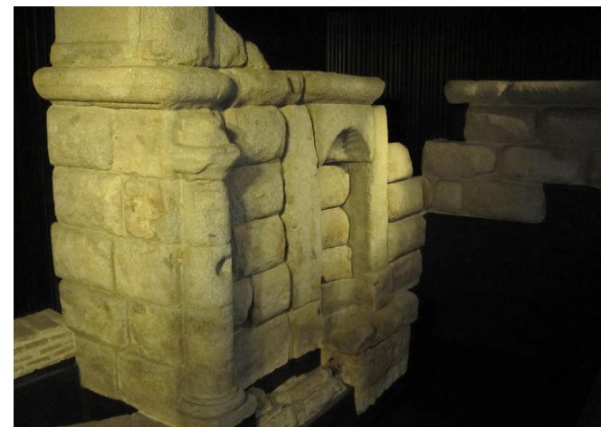
Fig. 12 Restos de la Fuente de los Caños del Peral