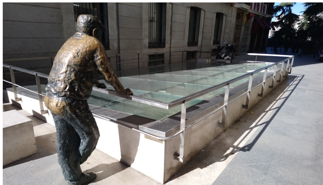
Fig. 6 Restos arqueológicos de la iglesia de la Almudena

La iglesia de la Almudena fue la principal iglesia de Madrid durante la Edad Media. El templo era un edificio pequeño, situado en la manzana comprendida entre las calles Mayor, Bailén y Almudena, solar que según los cronistas fue ocupado anteriormente por una mezquita. En los siglos XVII y XVIII fue reformada. Por su mal estado de conservación y con el objetivo de ensanchar la calle Mayor y alinear las manzanas de la zona fue derribada en 1868. En 1998 se llevó a cabo una intervención arqueológica que dejó al descubierto las cimentaciones y refuerzos de la zona de la cabecera que podemos ver actualmente.