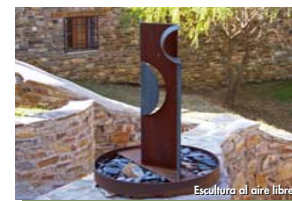
Escultura al aire libre