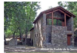
Molino de Puebla de la Sierra