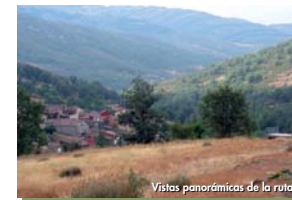
Vistas panorámicas de la ruta

Terminaremos nuestra senda disfrutando de una magnífica panorámica de los picos que rodean a Puebla de la Sierra, desde "Peña La Cabra" hasta "El Porreñón", antes de llegar al lavadero del pueblo.