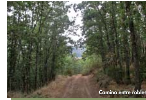
Camino entre robles

Terminaremos nuestra senda disfrutando de una magnífica panorámica de los picos que rodean a Puebla de la Sierra, desde "Peña La Cabra" hasta "El Porreñón", antes de llegar al lavadero del pueblo.