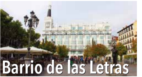
Barrio de las Letras

Chueca & Fuencarral: 这一地带以马德里的性少数群体社区闻名, 并成为大众休闲娱乐的焦点之一。如今, 这里已成为马德里著名的商业区之一, 这里开放自由, 集合着现代社会多种文化、时尚潮流始终是这一区的主流。Malasaña & Triball: Gran Vía, Fuencarral 和 Corredera Baja de San Pablo 这三条街围城了一个三角形综合商业区: 这里是购物、美食和文化的集合。Salesas: 这一区集中了一系列高端知名品牌, 同时店员服务周到细致。