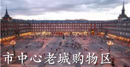
市中心老城购物区