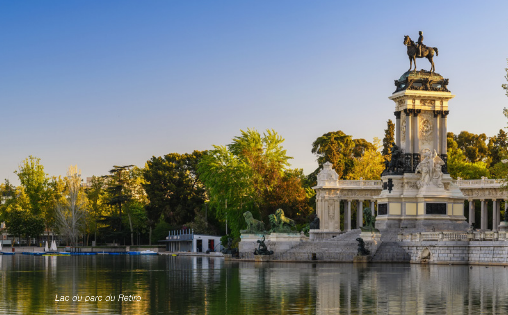
Lac du parc du Retiro