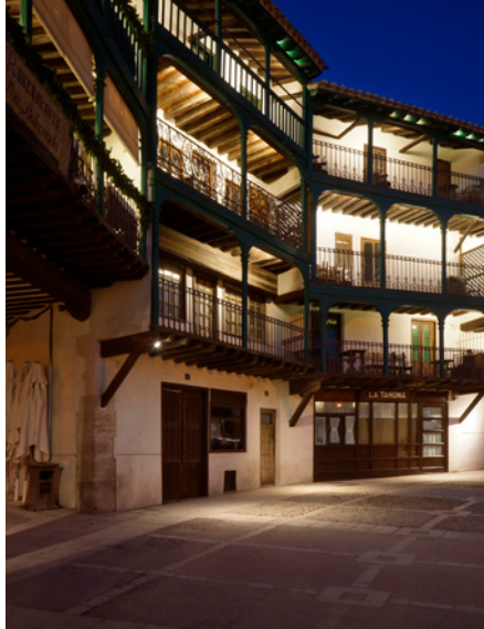
Plaza Mayor de Chinchón