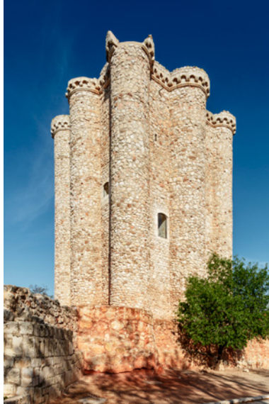
Castillo de Villarejo de Salvanés