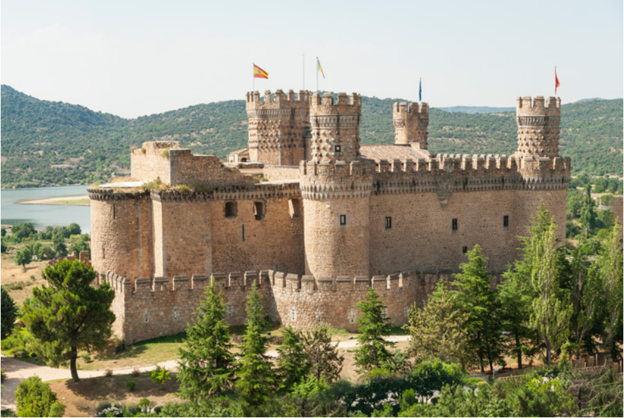
Manzanares el Real

de vidrio y una población para sus artesanos. Y así lo hizo. Nuevo Baztán es un ejemplo único de villa de la Ilustración. Una población surgida de la nada, con un monumental palacio-iglesia barroco y su singular casco histórico. Un impresionante conjunto arquitectónico diseñado por Churriguera. Todo nacido del sueño y ambición de un hombre ilustrado que quería cambiar España. Conoce su fascinante obra en el interesante Centro de Interpretación.