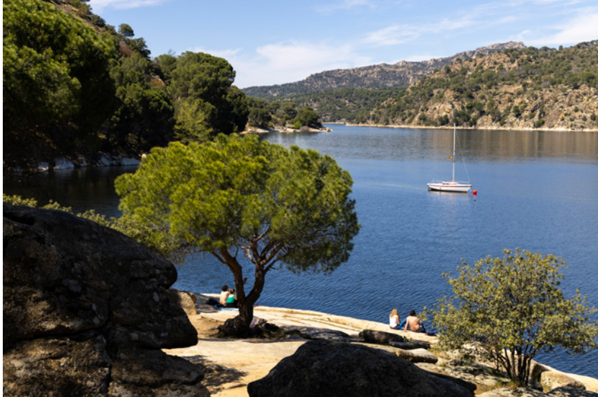
Pantano de San Juan

Vinos de Madrid, por la gran calidad de sus caldos. Si eres un aficionado al enoturismo, tienes que venir aquí y disfrutar también de su paisaje y su patrimonio. Desde la Torre del Homenaje del histórico castillo de Coracera, contemplarás los picos de la Sierra de Gredos y los mantos de bosques que cubren la Sierra Oeste de Madrid. Pero aún hay más; los embalses de San Juan y el de las Picadas son nuestros mares particulares en los que disfrutar en las jornadas de verano.