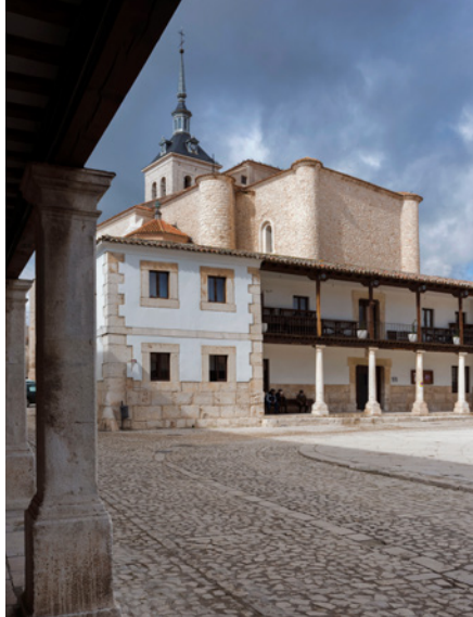
Plaza Mayor de Colmenar de Oreja

hoteleras de la Comunidad, dónde descansar y reponer fuerzas tras perderse por sus calles llenas de historia y su castillo, desde el que se divisan las mejores panorámicas de Chinchón.