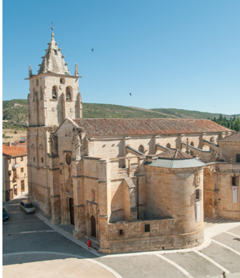
Iglesia de Santa María Magdalena en la plaza Mayor de Torrelaguna