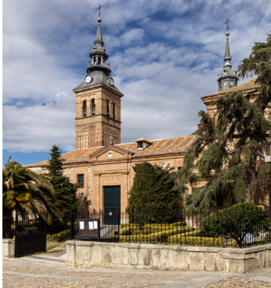
Iglesia de Nuestra Señora de la Asunción. Navalcarnero