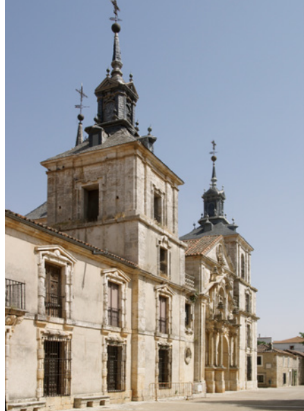
Palacio de Goyeneche en Nuevo Baztán