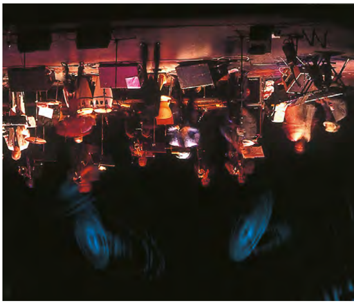
Espectáculo en Madrid.

Las terrazas de nuestros restaurantes, bares y hoteles son una expresión de nuestra cultura y forma de vida. Contamos además con una oferta de ocio nocturno imbatible para todos los gustos.