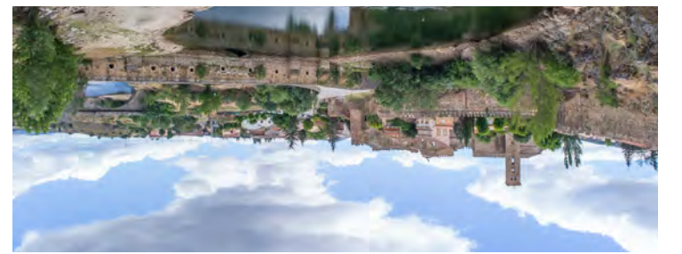
Buñago del Lozoya.

El patrimonio cultural de la Comunidad de Madrid es interminable. Alcalá de Henares, Aranjuez, San Lorenzo de El Escorial y la ciudad de Madrid cuentan con enclaves declarados Patrimonio Mundial de la UNESCO. El Paisaje de la Luz, en Madrid, aúna una de las principales ofertas museísticas más relevantes del planeta y otros lugares únicos como el Parque del Retiro.