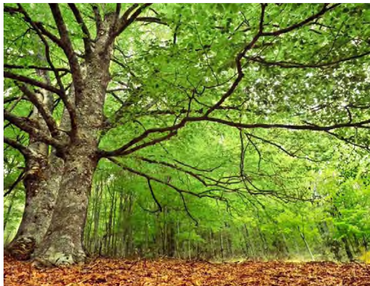
Hayedo de Montejo.

RECORRE LA REGIÓN A TRAVÉS DEL CAMINO DE SANTIAGO DE MADRID, UNA EXPERIENCIA ÚNICA Y TRANSFORMADORA