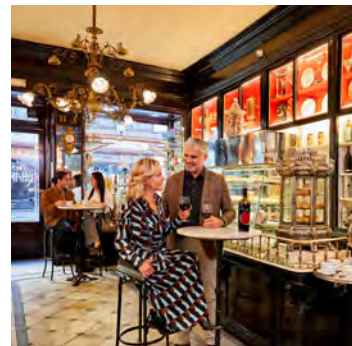
Izquierda: Barra del Lhardy. Derecha: Bodega.

Una agenda cultural y de ocio inabarcable