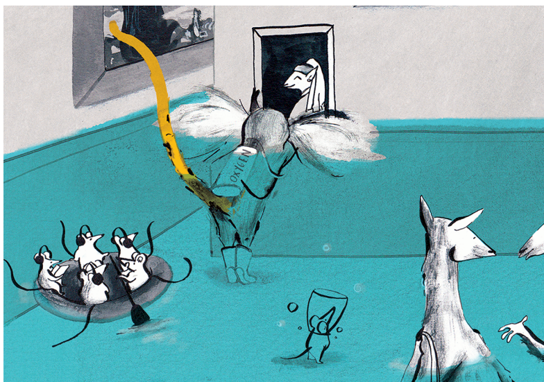
Ilustración tomada de la obra Inundado , de Mariajo Ilustrajo, cedida por la autora (detalle).

El catálogo contiene los datos de cada libro y un amplio comentario sobre su contenido, textos e ilustraciones.