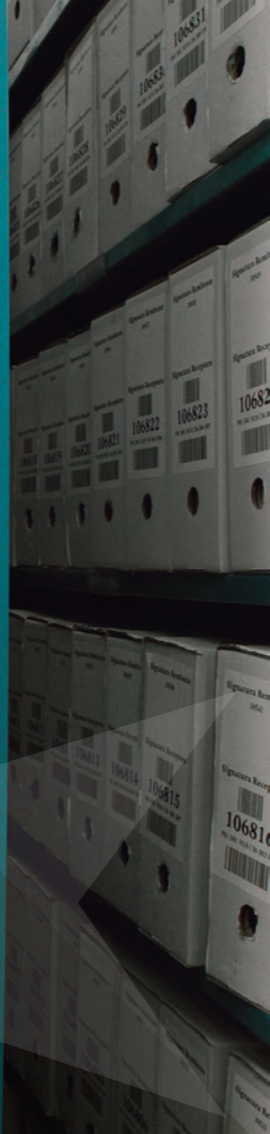
Depósito legal: M-5731-2023. Imprime B.O.C.M.

Este gigante patrimonial, uno de los archivos más reconocidos del país por la diversidad y relevancia de sus documentos, es la memoria del pasado, pero sobre todo del presente y del futuro, pues los documentos resultantes de las actuaciones de esta Comunidad que hoy son utilizados por ciudadanos e instituciones para la defensa de sus derechos e intereses mañana serán documentos imprescindibles para el estudio e investigación históricas de la Región de Madrid.