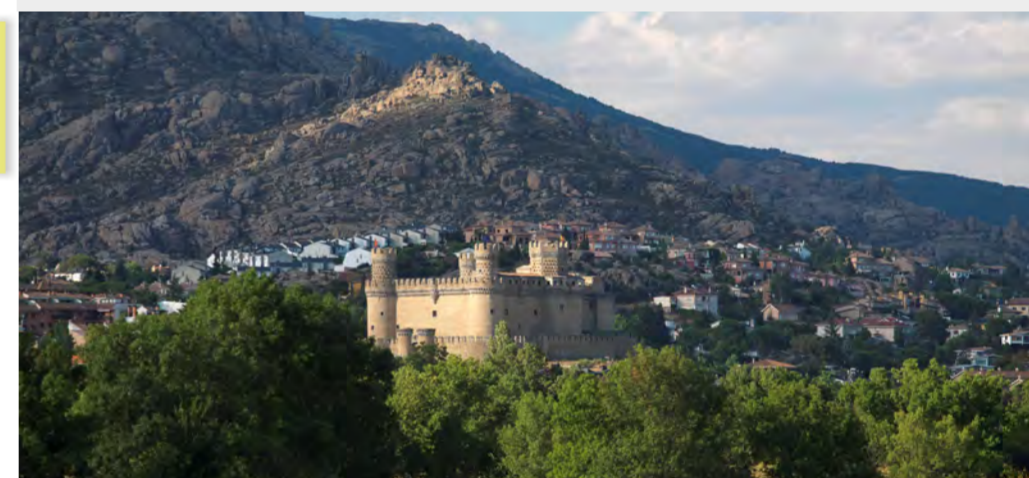
▷ Castillo de Manzanares El Real con la Pedriza al fondo