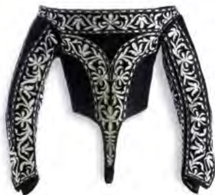
Jubón femenino , último tercio del s. XVII. Picado de seda, tafetán de lino, aplicaciones de metal. Museo del Traje (MTCE001019)

La herencia hispanomusulmana es sumamente importante para comprender los orígenes de la rica tradición textil de nuestro país. La llegada de los pueblos árabes en el siglo VIII introdujo en la Península el trabajo de la seda, y técnicas como el taqueté, el lampás, el samito o el damasco, que pervivirán en España durante toda la Edad Moderna incluso tras la expulsión de los moriscos. Al igual que sus técnicas, los ricos colores y los complejos