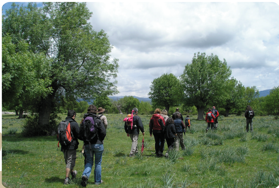
Autora: Carolina López Zapatero

conocimiento y disfrute responsable del patrimonio natural y cultural, a través del fomento de comportamientos respetuosos con el medio y su conservación.