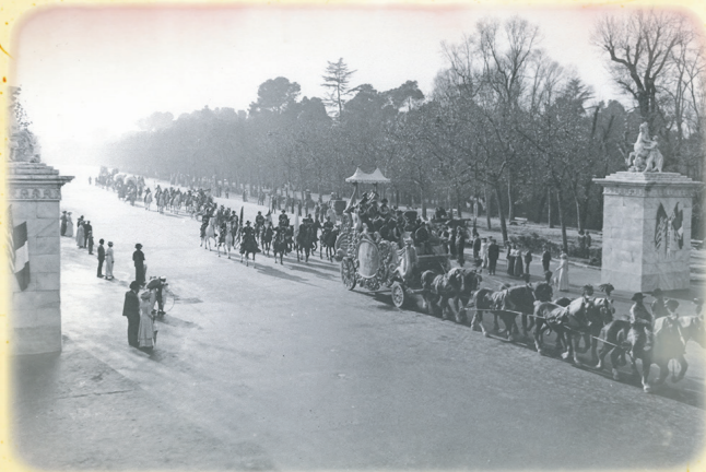
El fabuloso mundo del circo . Parque de El Retiro.

Las producciones Bronston inmortalizaron los paisajes madrileños en algunas de las epopeyas más memorables del cine como son El capitán Jones , Rey de Reyes , El Cid , 55 días en Pekín , La caída del imperio romano o El fabuloso mundo del circo . La plaza de Chinchón, La Pedriza en Manzanares el Real, la playa del Alberche en Aldea del Fresno, los montes de Navacerrada o La Cabrera, la Ermita de los Remedios de Colmenar Viejo, el Palacio Real de Aranjuez, o ya en la capital, El Retiro o el Palacio Real, se convirtieron en escenarios de duelos, batallas, y amores apasionados.