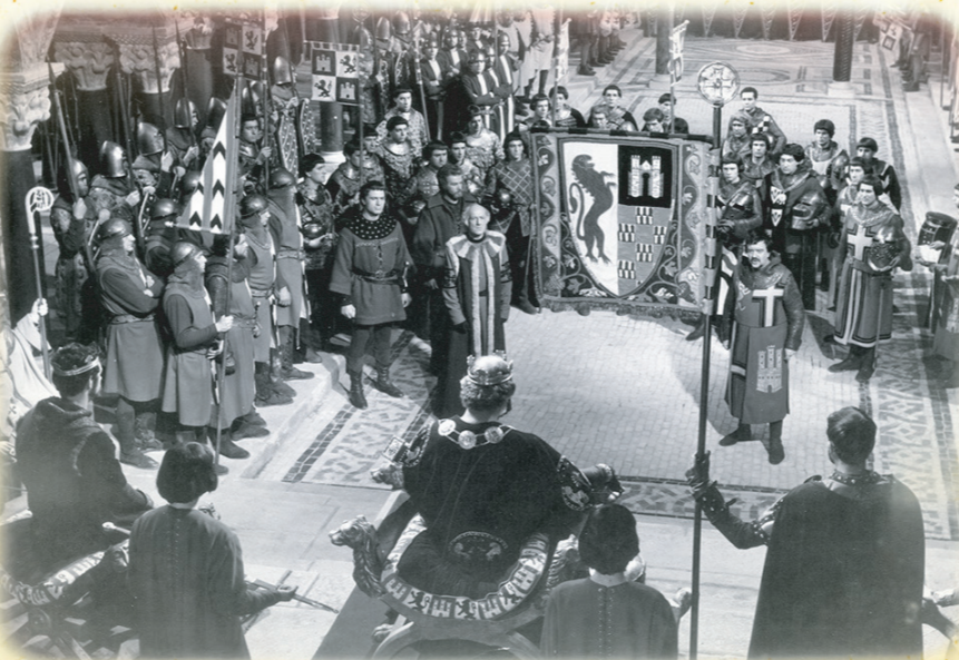
El Cid . Estudios Chamartín.

Y por supuesto, en el municipio de Madrid , se rodaron todas las producciones Bronston, tanto en sus estudios, como en la cementera Portland de Valderribas o el antiguo Circo Price. A destacar entre estas, las secuencias rodadas en el parque de El Retiro para El fabuloso mundo del circo , tanto el desfile en el paseo de coches, como el fastuoso final para el que hubo que vaciarse y limpiar el estanque, o el momento de Bette Davis sentada en el trono del Palacio Real en El capitán Jones .