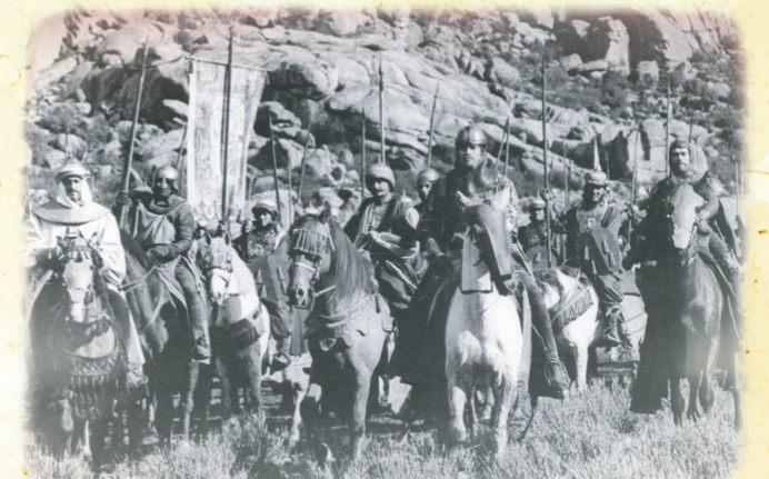
El Cid . Manzanares el Real.