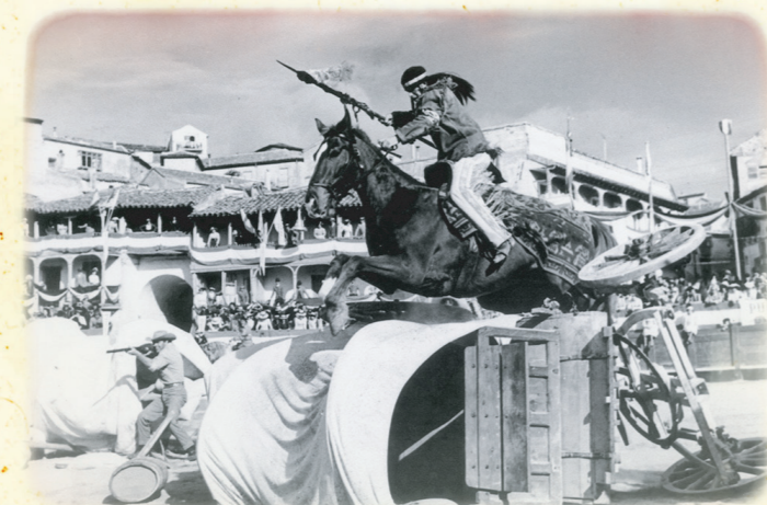
El fabuloso mundo del circo. Chinchón.