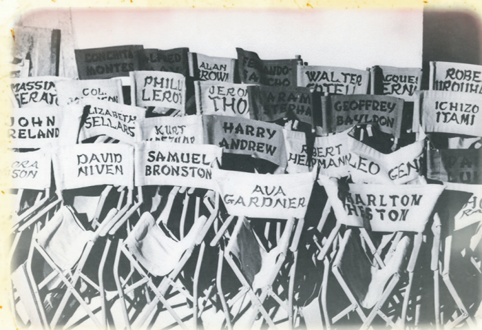
55 días en Pekín. Las Rozas