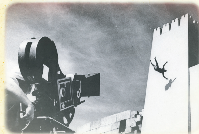
Rodaje de Rey de reyes.