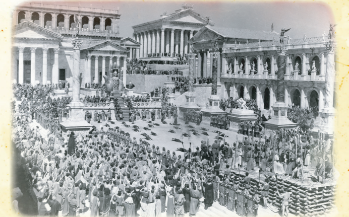
La caída del imperio romano . Las Rozas.

Los estudios cinematográficos de mayor espacio, en aquel Madrid de finales de los cincuenta y principios de los sesenta, los Sevilla films, los CEA y los Chamartín, después llamados Bronston, acogieron fastuosos decorados de castillos y palacios. Y a la sombra de aquel imperio cinematográfico, surgen otras producciones rodadas con sus medios, como son Pampa salvaje o El fantástico mundo del Doctor Coppelius , películas donde participan otros importantes nombres como Robert Taylor, Walter Slezak, Paul Naschy o Michael Rennie, rodadas en Pózuolo de Alarcón, Villamanta o San Martín de Valdeiglesias.