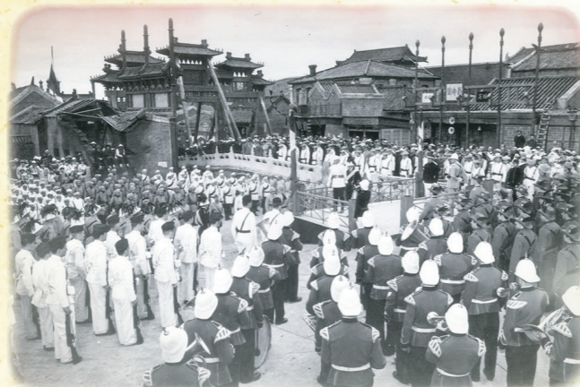
55 días en Pekín . Las Rozas.