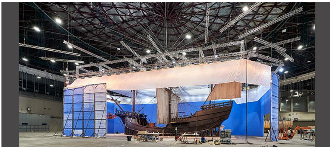
Pabellón 12 de IFEMA Madrid

Productoras / Production Companies: Elcano Media, A.I.E. (100%, Bilbao) ; Boundless The Film Ltd. (25%, Reino Unido / UK)