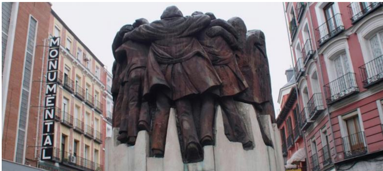
Monumento a los abogados de Atocha (Plaza Antón Martín, Madrid)

Productoras madrileñas / Madrid Production Companies: Parias De La Tierra Films, S.L. (Madrid)