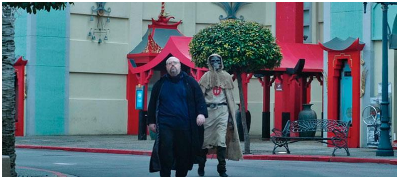
Teatro Chino en el Parque Warner Madrid, San Martín de la Vega (Captura del tráiler / Trailer screenshot)