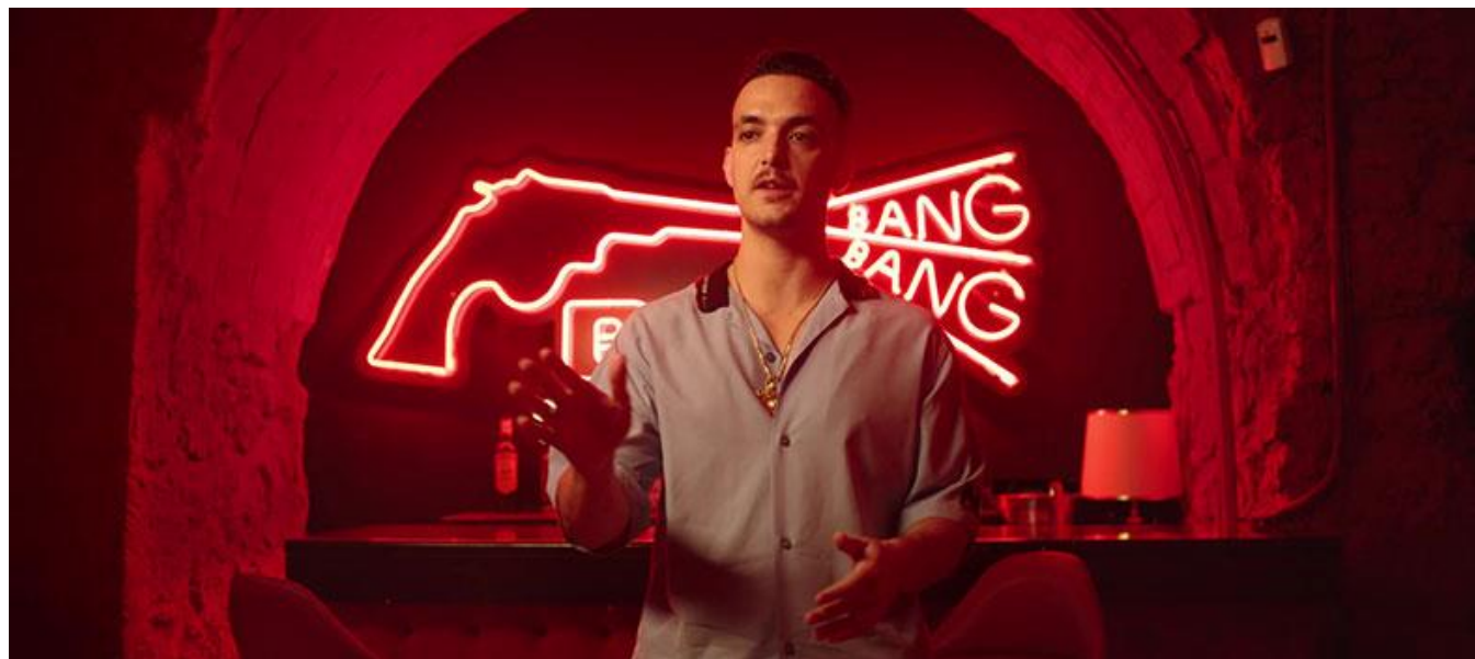
C. Tangana en "Estupenda Bar", en Malasaña, Madrid

Productoras / Production Companies: Señor y Señora, S.L. (50%, Donostia / San Sebastián) ; Código Sur Producciones, S.L. (50%, Sevilla)