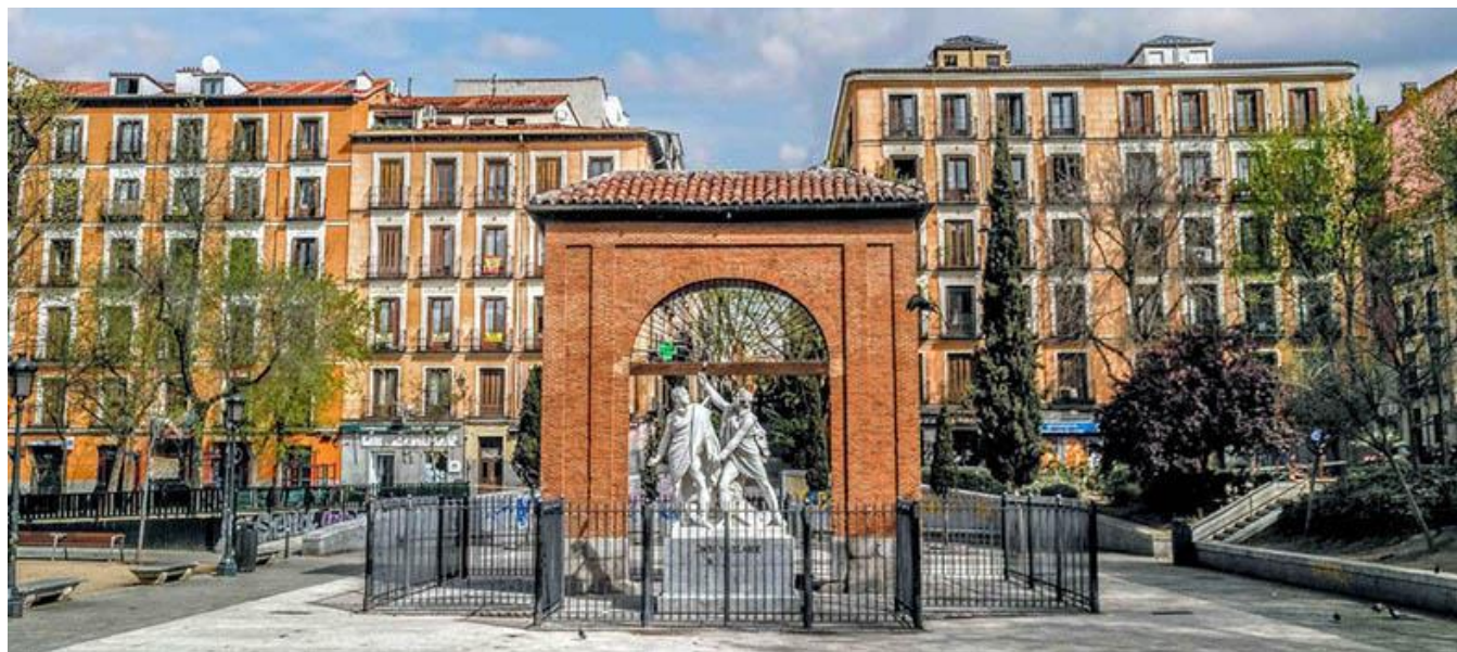
Plaza del Dos de Mayo, Madrid