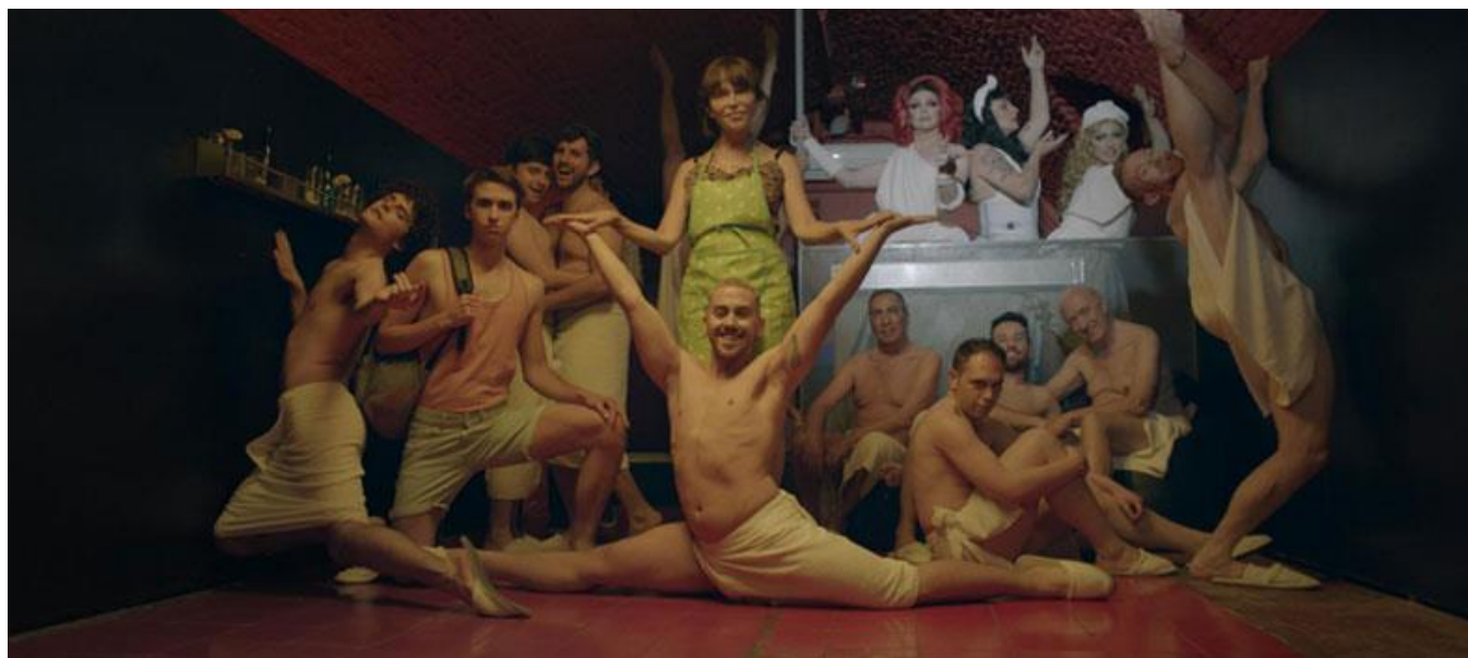
Local Boyberry en Madrid

Productoras / Production Companies: Sophia Network, S.L.U. (Madrid)