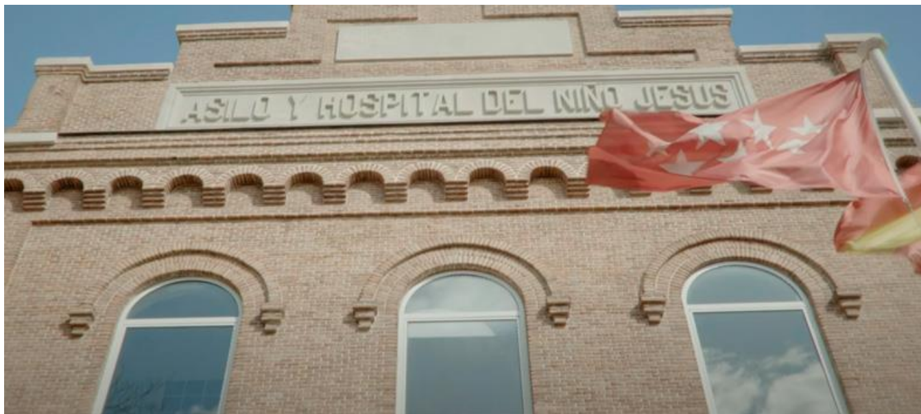
Hospital Niño Jesús, Madrid (Captura del tráiler / Trailer screenshot)

Productoras madrileñas / Madrid Production Companies: Telespan 2000 S.L. (Madrid)