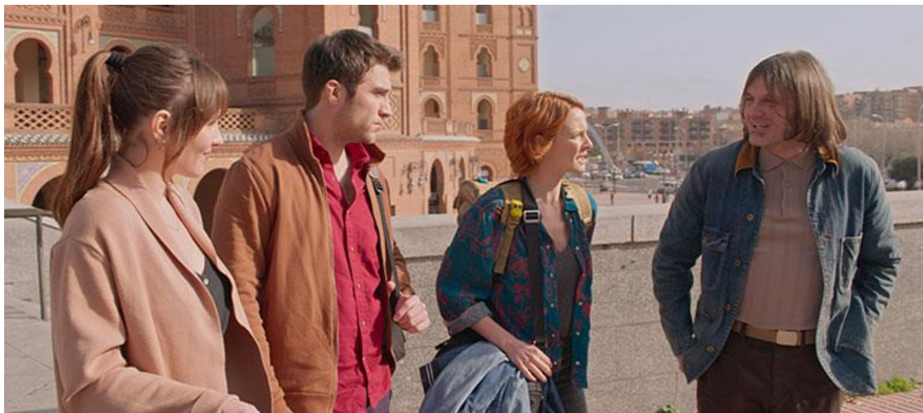
Las Ventas, Madrid

Productoras / Production Companies: Álamo Audiovisual Quinta Parte, A.I.E. (99%, Molina de Segura, Murcia) ; A Contracorriente Films, S.L. (0,5%, Barcelona) ; Álamo Producciones Audiovisuales. S.L. (0,3%, Granada) ; Neon Producciones, S.L. (0,2%, Guadalupe, Murcia)