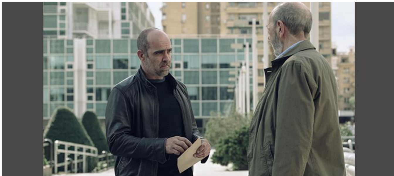
Plaza Pablo Ruiz Picasso, Azca, Madrid

Productoras / Production Companies: Proyecto Emperador, A.I.E (89,1%, A Coruña) ; Vaca Films Studio, S.L. (0,9%, A Coruña) ; Playtime (10%, Francia / France)