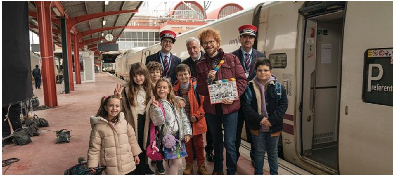
Estación de Chamartín (imagen de rodaje / Shooting image)

Otras productoras / Other Production Companies: Bowfinger International Pictures, S.L. (0,5% Donostia / San Sebastián)