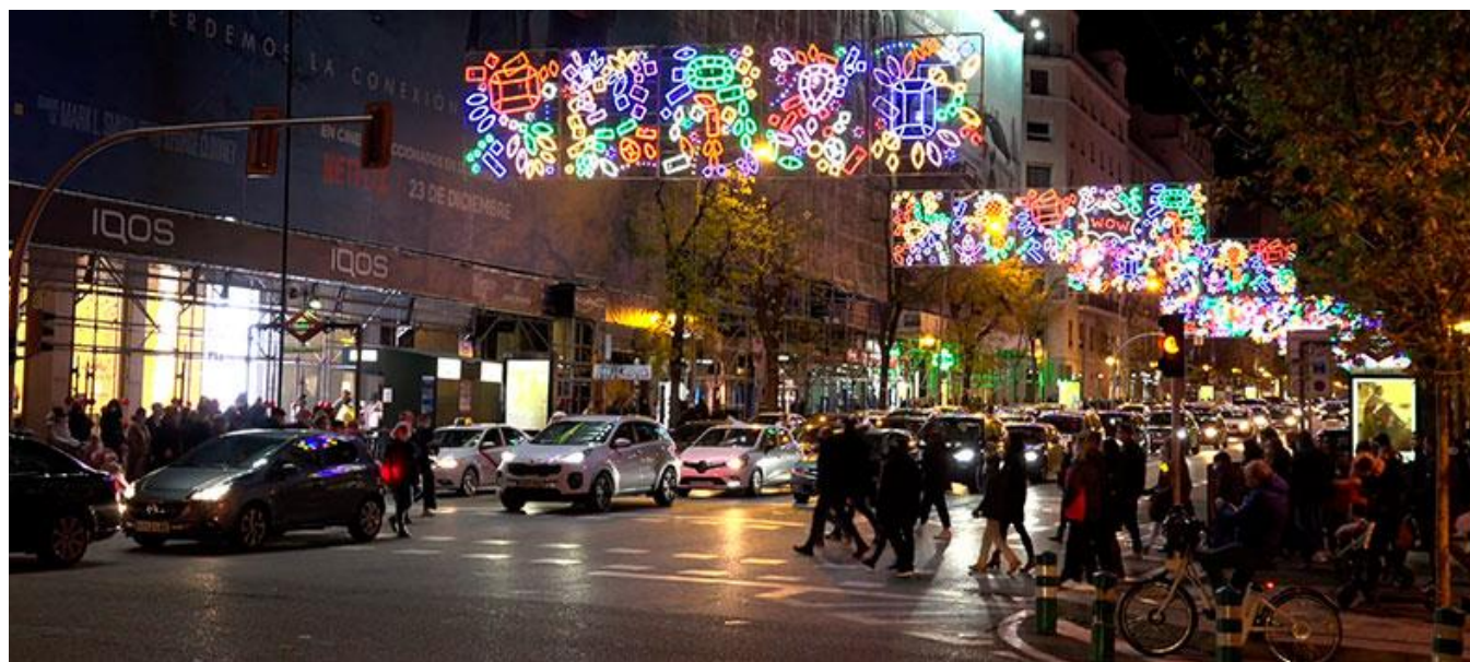
Calle de Goya esquina calle Serrano, Madrid (Captura del tráiler / Trailer screenshot)

Productoras madrileñas / Madrid Production Companies: Toma 24 Producciones Cinematográficas S.L. (Madrid)