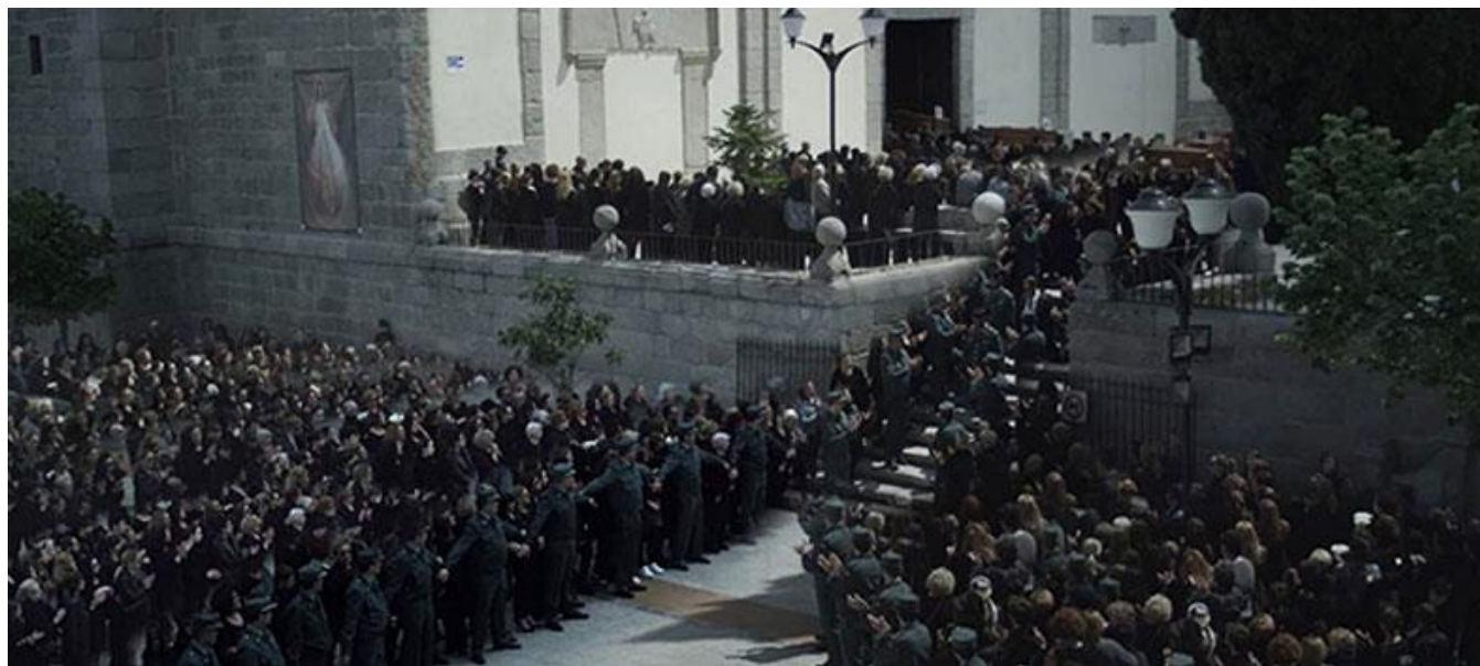
Iglesia de San Martín Obispo en San Martín de Valdeiglesias

Productoras madrileñas / Madrid Production Companies: Francisco Javier García Sáenz (97%, Madrid) ; Spainwood MRP, S.L. (3%, Madrid)