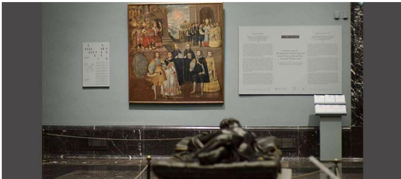
Museo del Prado, Madrid

Productoras madrileñas / Madrid Production Companies: Lopez-Li Films, S.L. (83,87% Madrid) ; Sociedad Mercantil Corporación de Radio Televisión Española, S.A.U. (16,13% Pozuelo de Alarcón, Madrid)