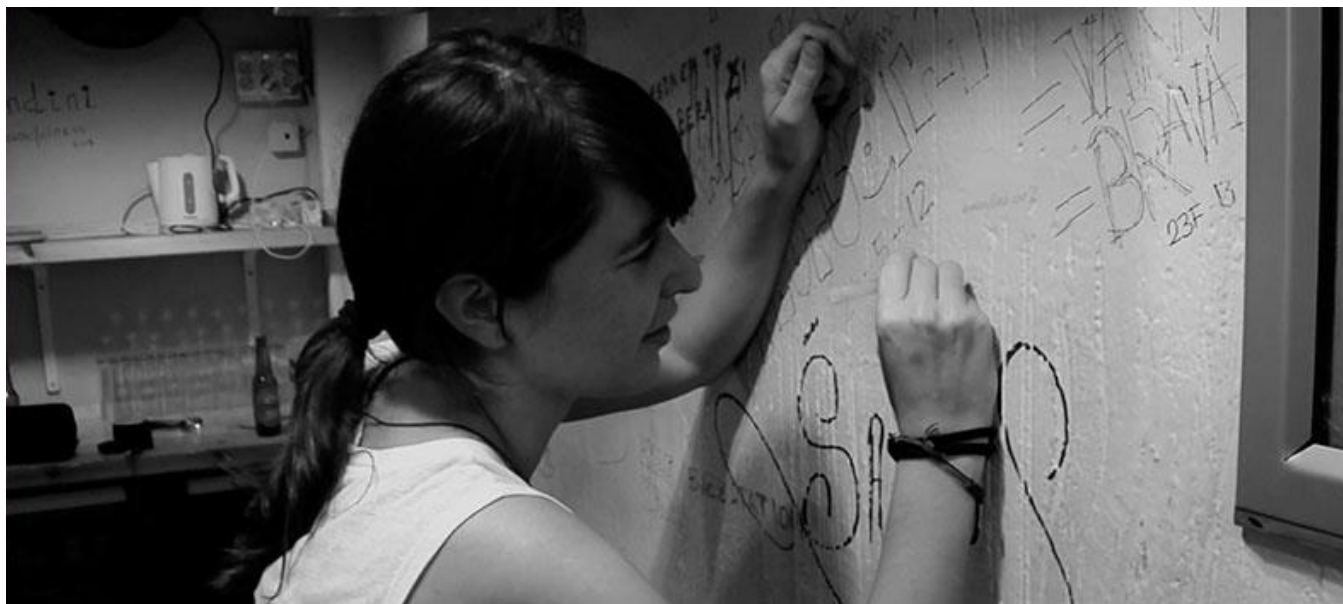
Captura del tráiler / Trailer screenshot

Productora madrileña / Madrid Production Company: Nylon Brandlasticidad, S.L. (Madrid)