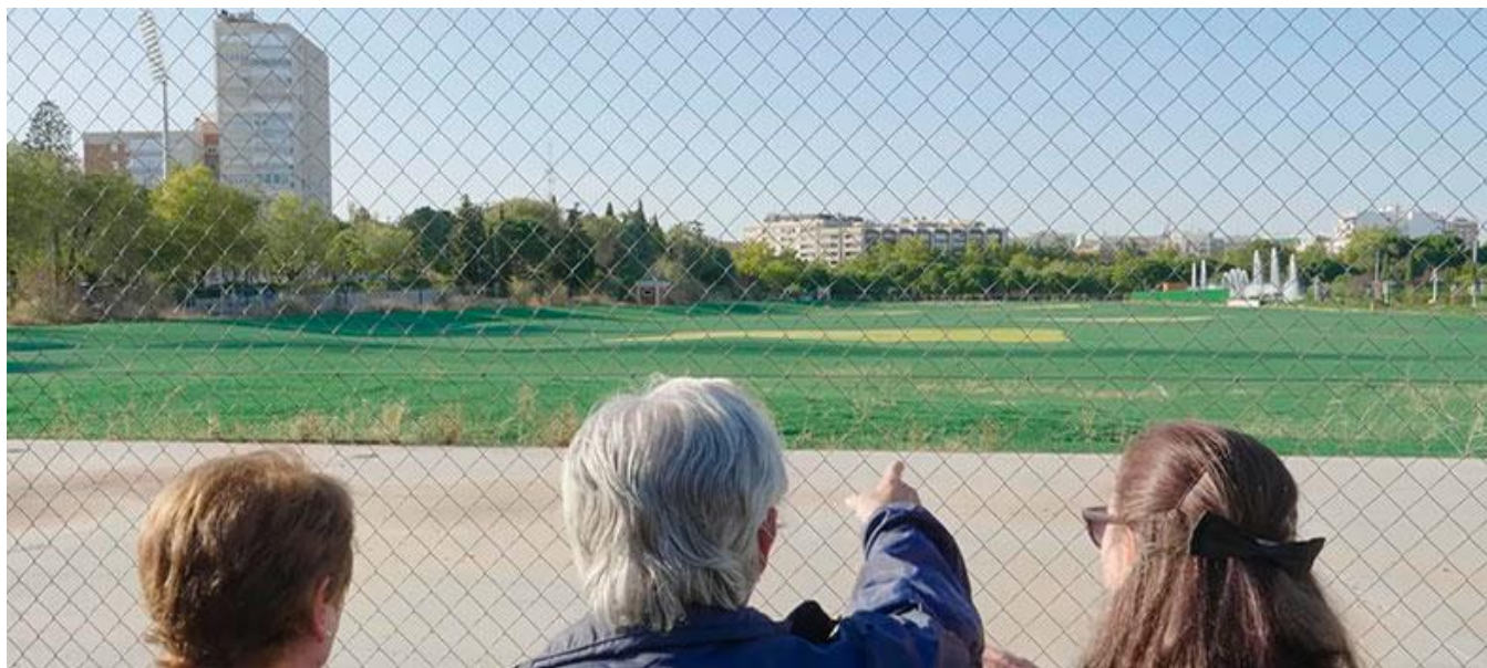
Parque de Chamberí (Captura del tráiler / Trailer screenshot)

Productoras madrileñas / Madrid Production Companies: Miguel Ángel Sánchez (Madrid)