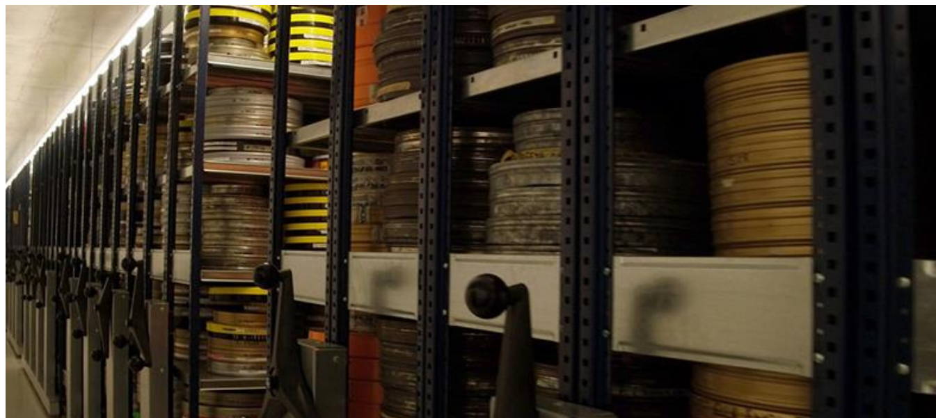
CCR, Filmoteca Española, Madrid

Productoras / Production Companies: El Grifilm, S.L. (55,13%, Uruña, Valladolid) ; 11025988 Canada Inc. (44,87%, Canadá / Canada)