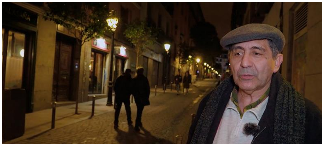
Barrio de Malasaña (Captura del tráiler / Trailer screenshot)

Productora madrileña / Madrid Production Company: Juan José Castro Sáez