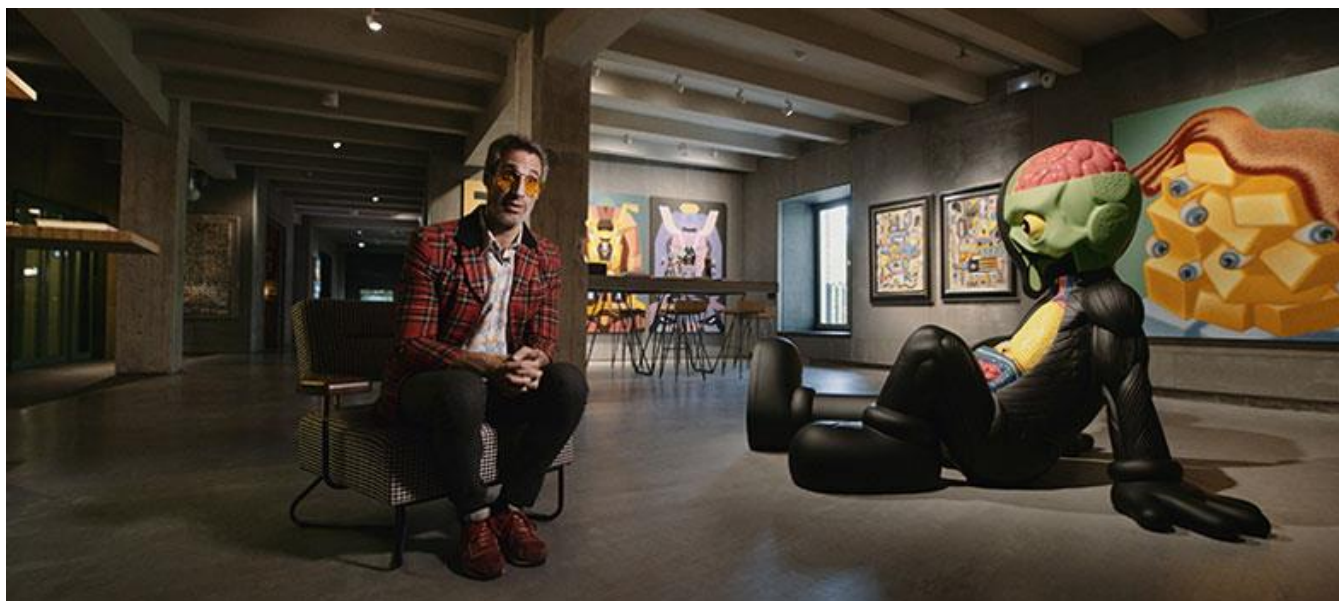
Espacio Solo en Madrid

Productora madrileña / Madrid Production Company: Solo Contemporary, S.L.U. (Madrid)