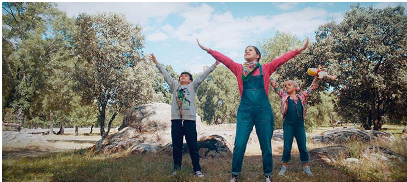
Becerril de la Sierra

Productora / Production Company: Tareas de la Casa 2020, A.I.E. (L'Eliana, Valencia)