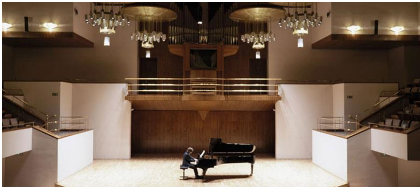
Auditorio Nacional de Música, Madrid

Otras productoras / Other Production Companies: Valladolid Esarte, S.L. (60%, Viana de Cega, Valladolid) ; Estrategias para el Arte y la Cultura, S.L. (20%, Valladolid)