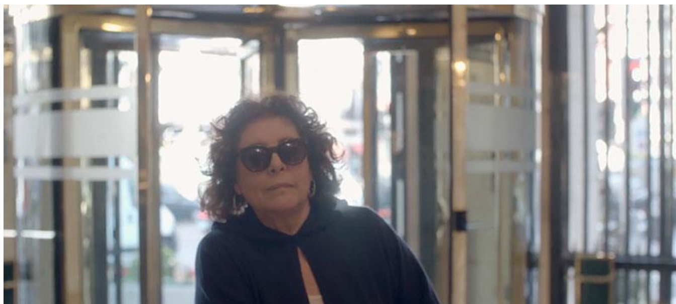
Hotel Wellington, Madrid (Captura del teaser / Teaser screenshot)

Otras productoras / Other Production Companies: Distinto Duero, S.L.U. (7,81%, Salamanca)