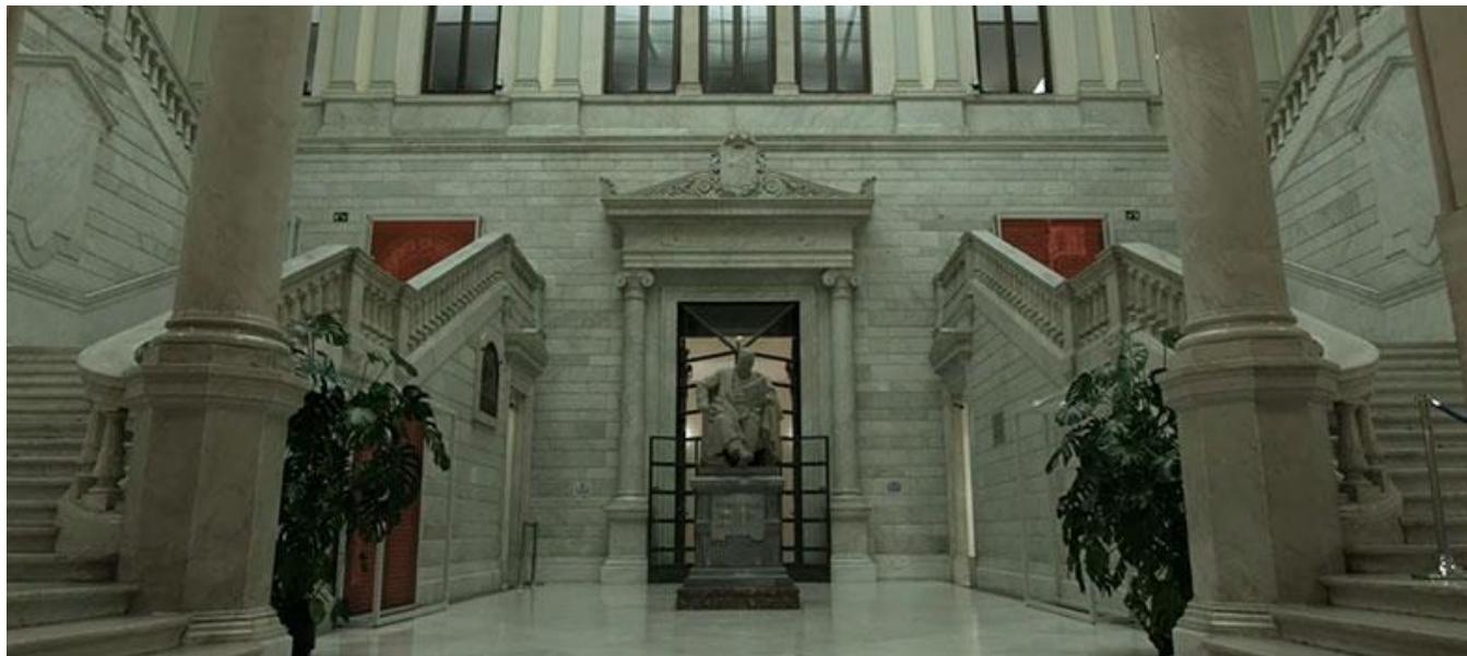
Entrada principal de la Biblioteca Nacional en Madrid (Captura del tráiler / Trailer screenshot)

Productora / Production Company: Miguel Herrero Herrero (Sax, Alicante)