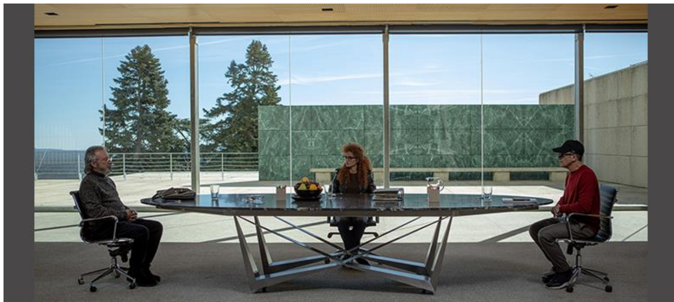
Teatro Auditorio de San Lorenzo de El Escorial

Productoras / Production Companies: Mediaproducción S.L.U. (80%, Barcelona) ; Prom T.V., S.A.U. (20%, Argentina)