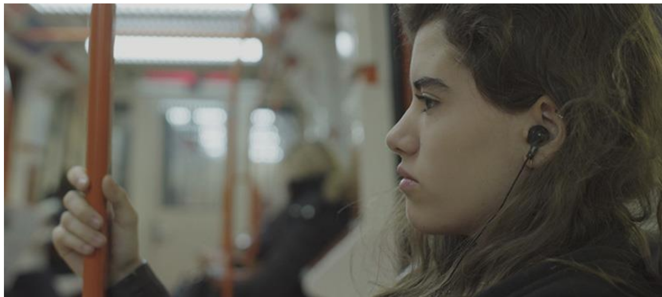
Metro de Madrid

Productora madrileña / Madrid Production Company: Los Ilusos Films, S.L.