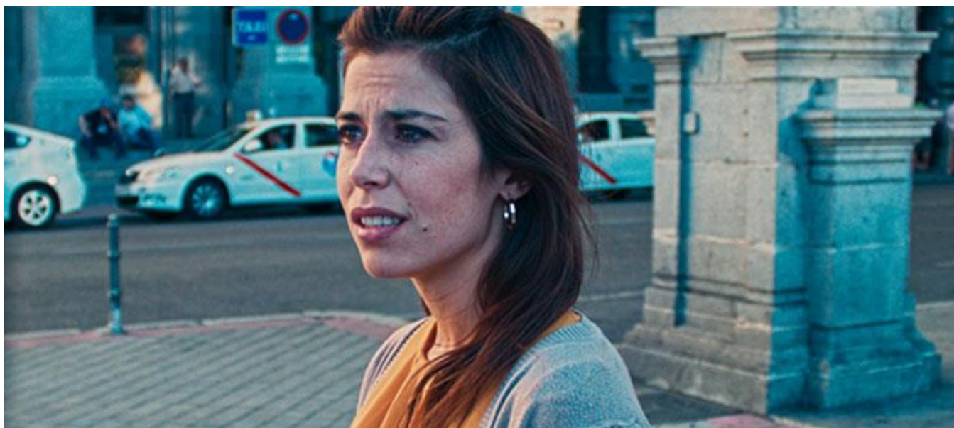
Plaza de Cibeles, Madrid

Productora madrileña / Madrid Production Company: Alfredo Carrasco (ACFilms Producciones)