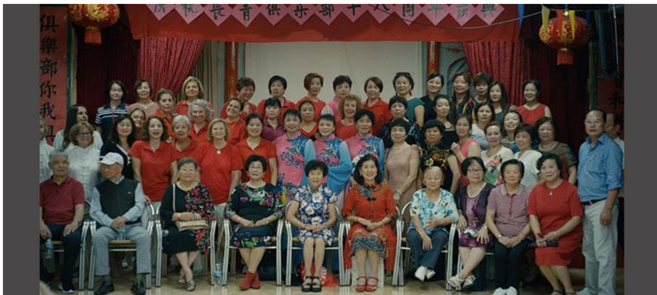
Centro de Mayores Chino, en Usera

Productora madrileña / Madrid Production Company: IMVAL Madrid S.L. (Madrid)