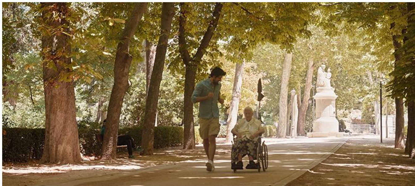
Parque de El Retiro, Madrid, con la estatua de fray Pedro Ponce de León al fondo

Productora madrileña / Madrid Production Company: Paciencia Films, S.L. (Madrid)