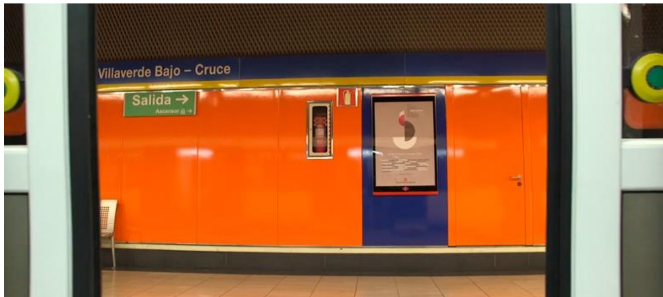
Metro de Madrid (Captura del tráiler / Trailer screenshot)