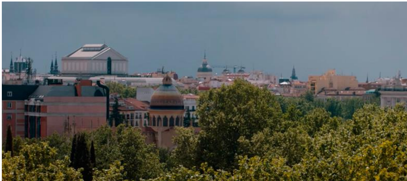
Captura del tráiler / Trailer screenshot

Serie web / Web series / Temporada 2. 8 capítulos / Season 2. 8 episodes / 30 min. aprox. / approx. (capítulo / episode)