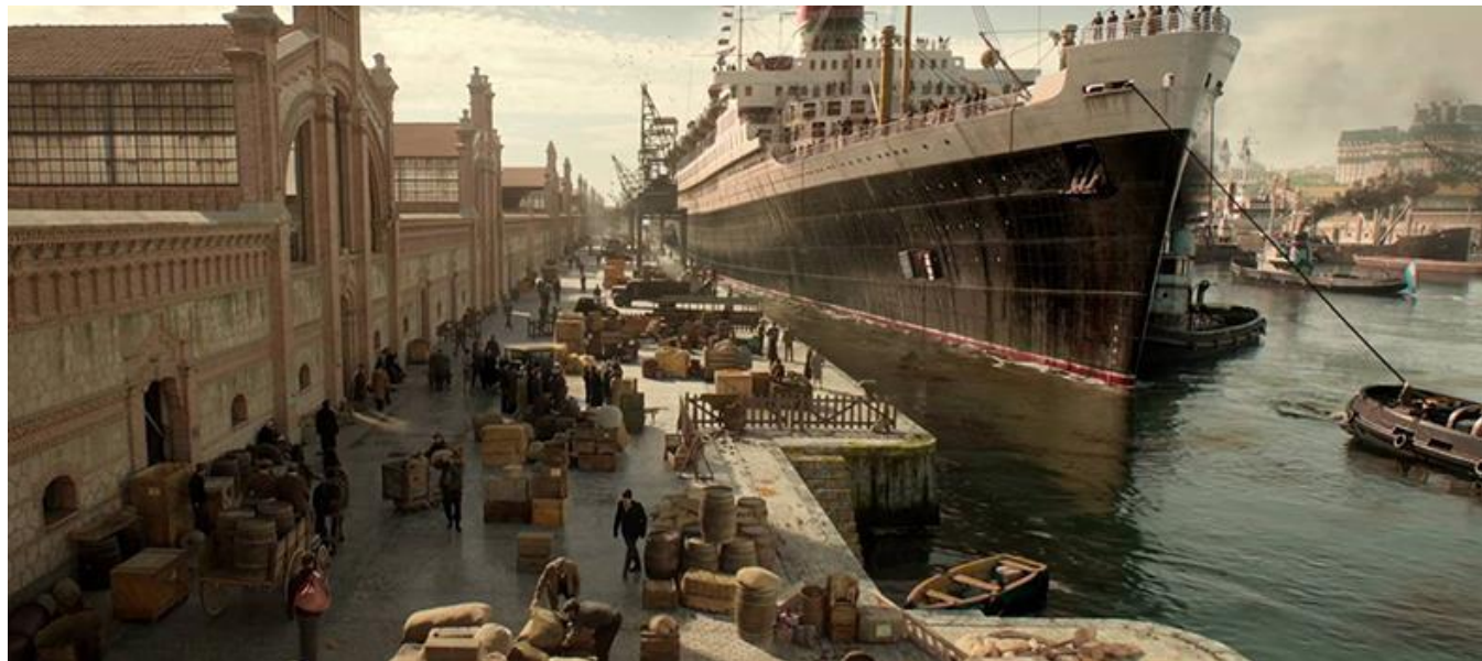
Matadero Madrid (Como Puerto de Buenos Aires / As Port of Buenos Aires)

Medios / Media: Movistar+, #0 por Movistar Plus+