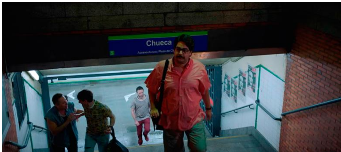
Metro de Chueca, Madrid (Captura del Tráiler / Trailer screenshot)

Serie de TV / TV series / Temporada 1. 6 capítulos / Season 1. 6 episodes / 30 min. aprox. / approx. (capítulo / episode)