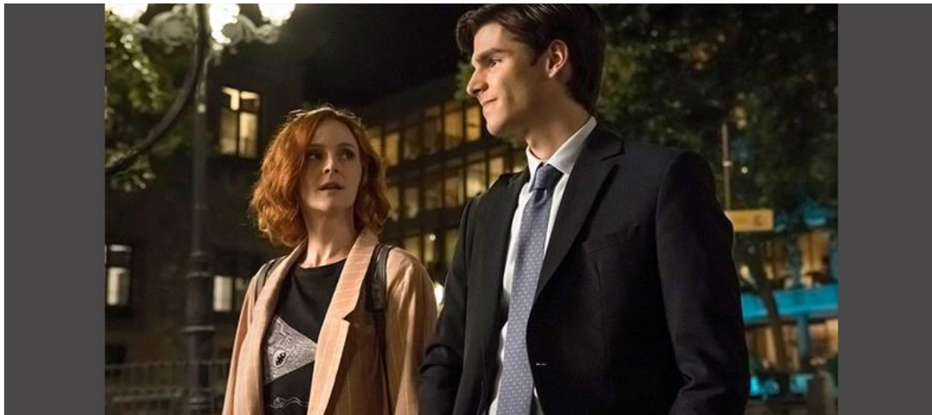
Plaza del Rey, Madrid

Serie de TV / TV series / Temporada 1. 6 capítulos / Season 1. 6 episodes / 45 min. aprox. / approx. (capítulo / episode)