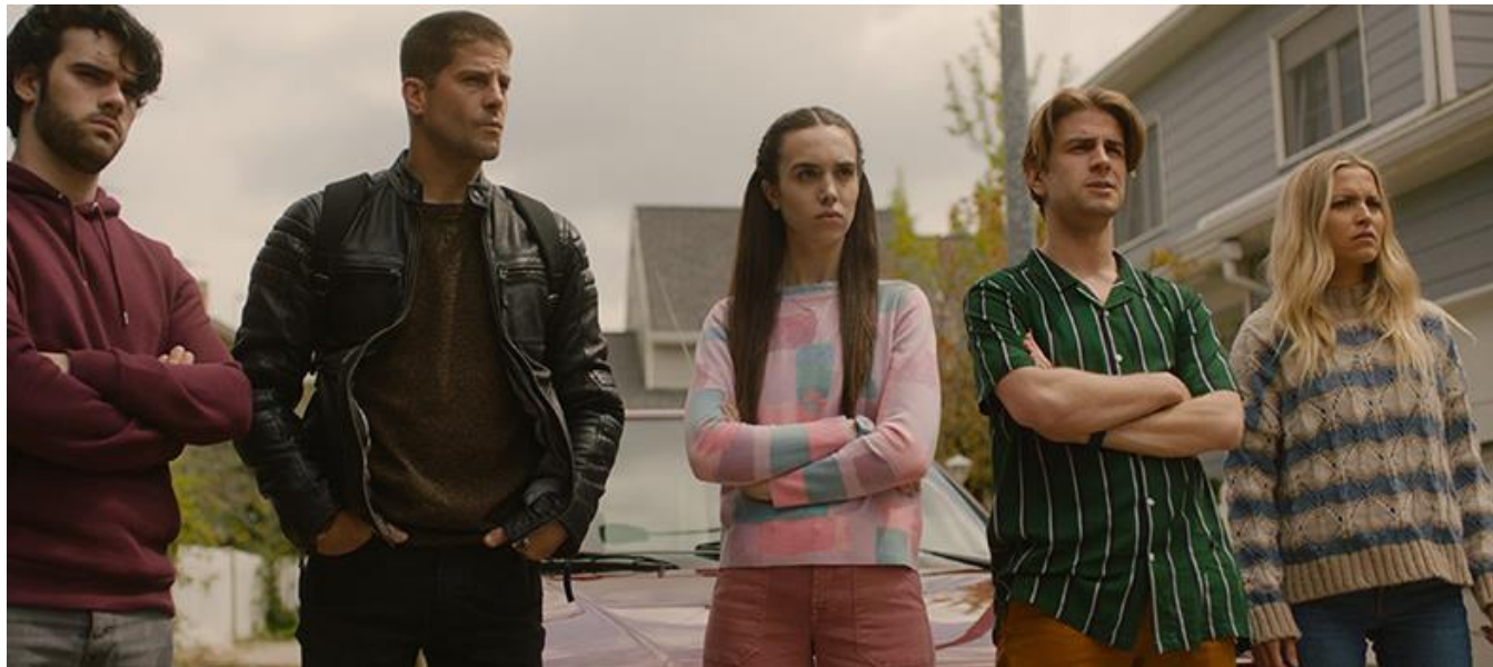
Calle de San Juan Cruz de Villanueva de la Cañada

Miniserie TV / TV Mini-series / Temporada 1. 4 capítulos / Season 1. 4 episodes / 50 min. aprox. / approx. (capítulo / episode)