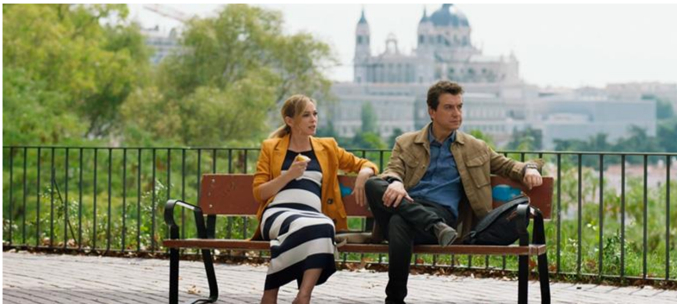
Captura del tráiler / Trailer screenshot

Serie de TV / TV series / Temporada 3. 10 capítulos / Season 3. 10 episodes / 29 - 43 min. aprox. / approx. (capítulo / episode)