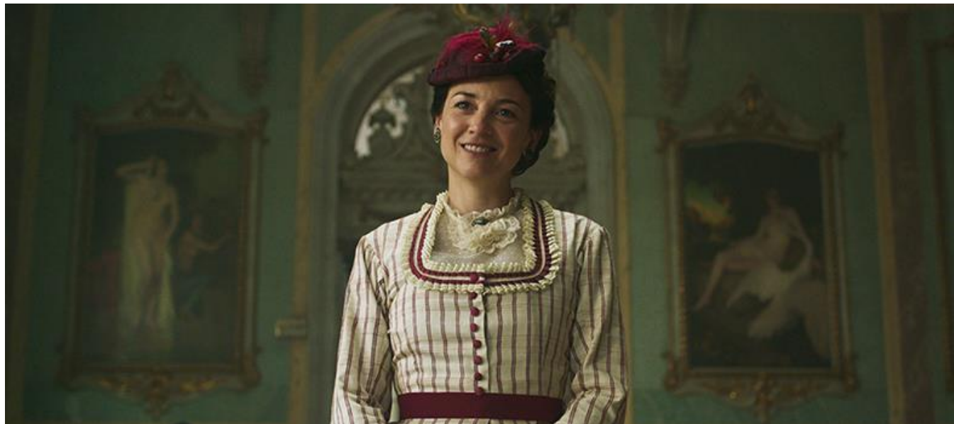
Salón Real del Casino de Madrid

Medios / Media: Amazon Prime Video, Atresmedia Televisión (2022)