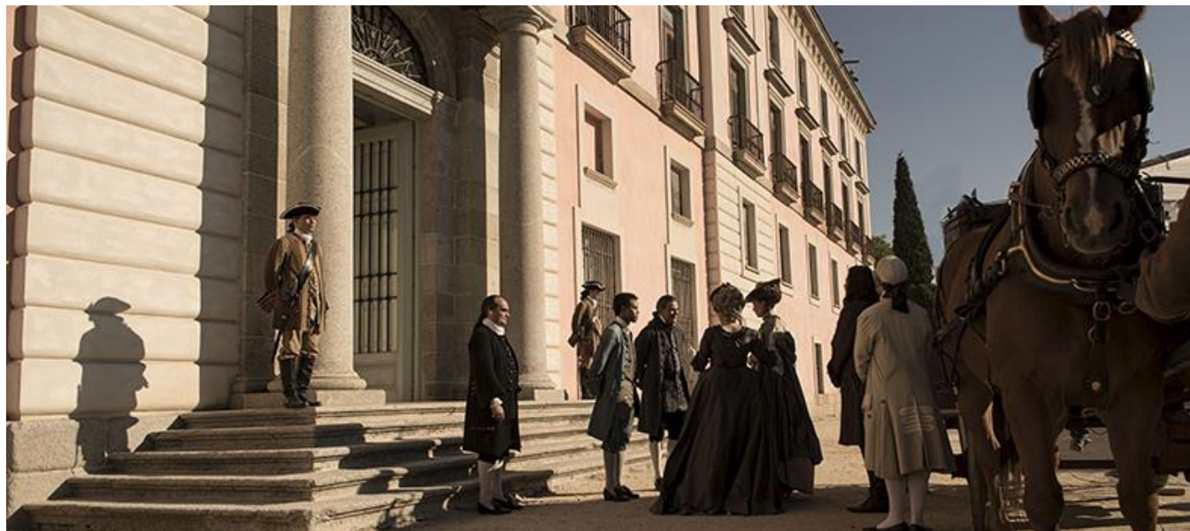
Fachada posterior del Palacio del Infante Don Luis, Boadilla del Monte

Medios / Media: Atresplayer Premium, Antena 3, Netflix