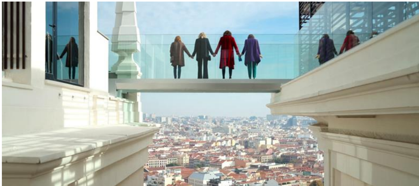
Hotel Riu Plaza de España, Madrid

Serie de TV / TV series / Temporada 2. 8 capítulos / Season 2. 8 episodes / 40-46 min. aprox. / approx. (capítulo / episode)