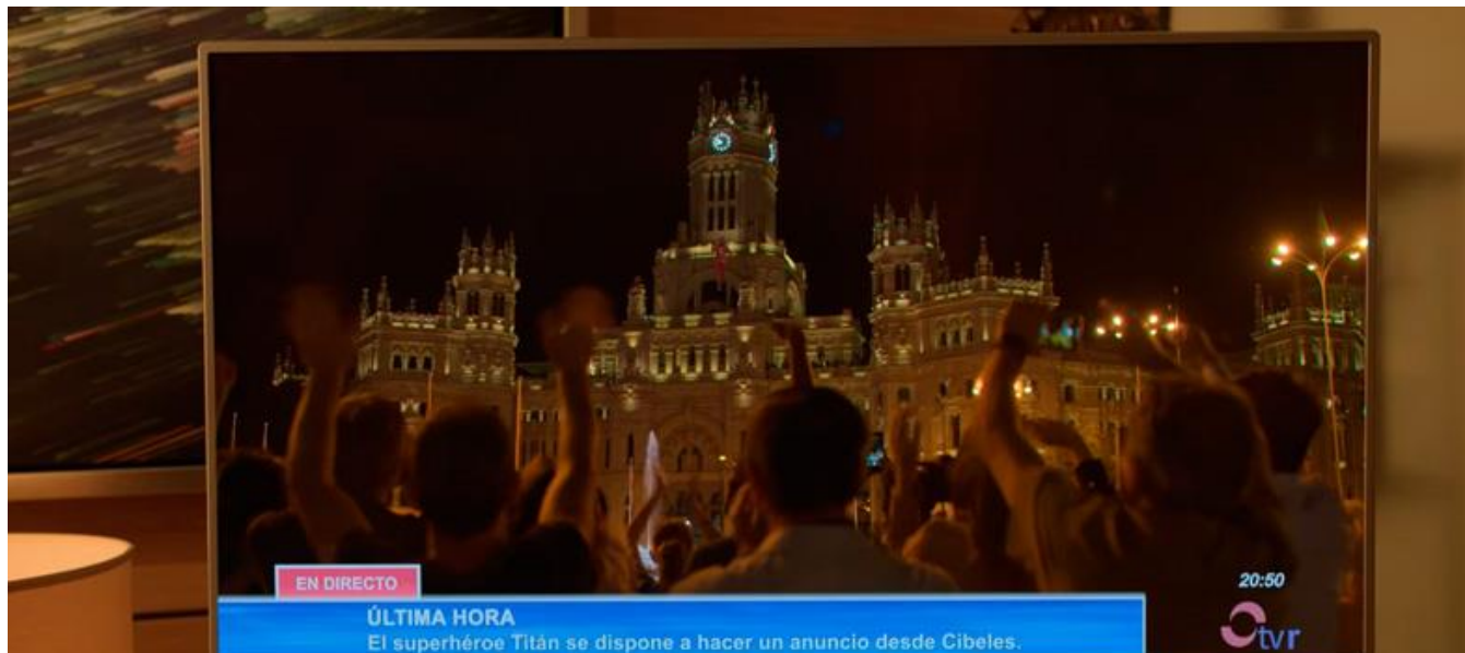
Plaza Cibeles, Madrid (Captura del Tráiler de Netflix) / Plaza Cibeles, Madrid (Netflix Trailer screenshot)

Serie de TV / TV series / Temporada 2. 8 capítulos / Season 2. 8 episodes / 30 min. aprox. / approx. (capítulo / episode)