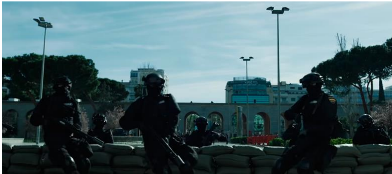
Jardines de Nuevos Ministerios, enfrente del Ministerio de Trabajo y Economía Social

Serie de TV / TV series / Temporada 5. 10 capítulos / Season 5. 10 episodes / 49-76 min. aprox. / approx. (capítulo / episode)