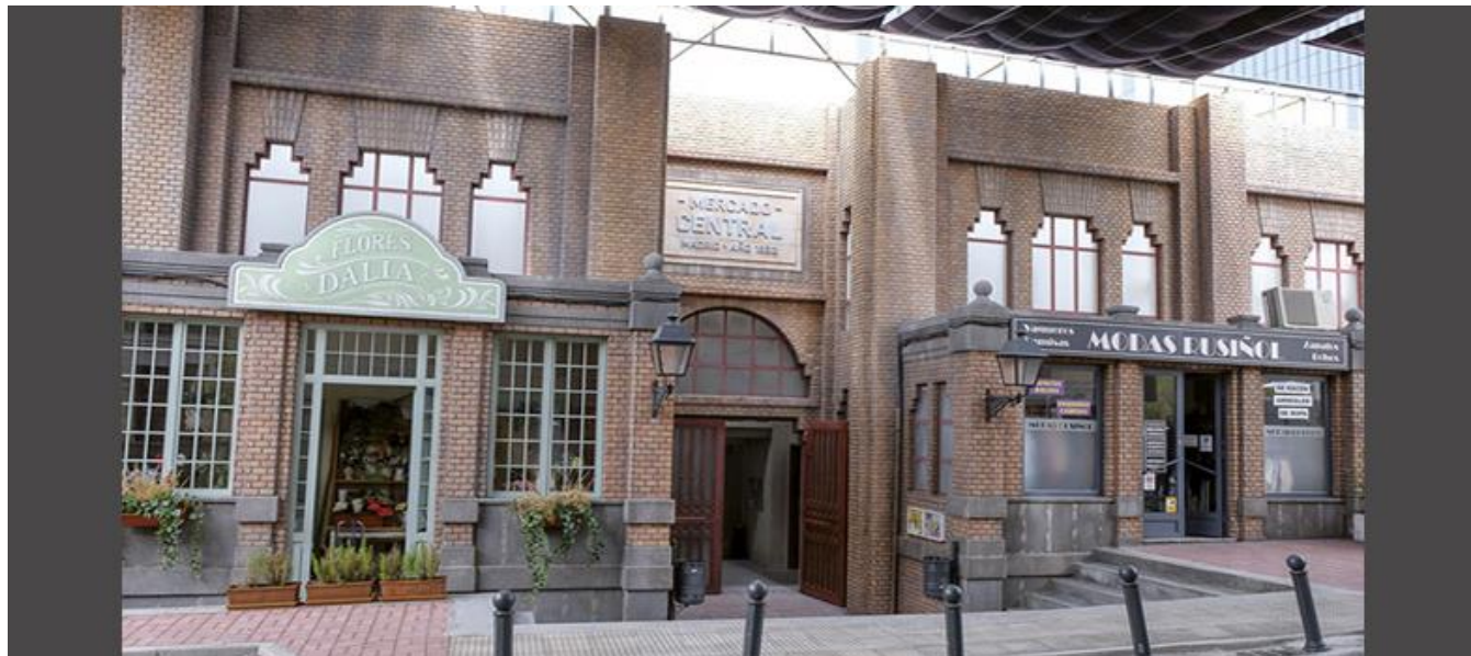
Recreación del Mercado de Tirso de Molina de Madrid, grabado en plató / Set recreation of the Tirso de Molina Market in Madrid

Serie diaria de TV / TV daily series / Temporadas 2. 71 capítulos / Seasons 2. 71 episodes / 50 min. aprox. / approx. (capítulo / episode)