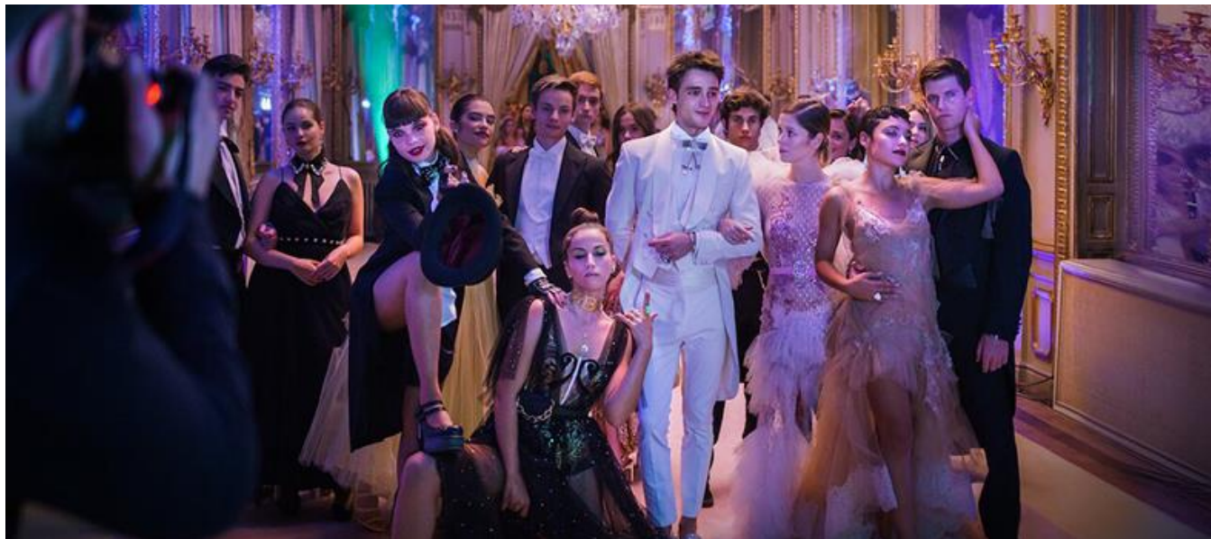
Palacio de Fernán Núñez en Madrid

Serie de TV / TV series / Temporada 4. 8 capítulos / Season 4. 8 episodes / 50 min. aprox. / approx. (capítulo / episode)