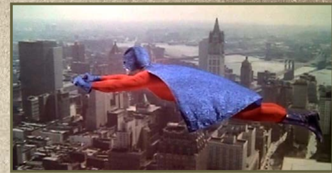
"Supersonic man". Estudios Piquer de Madrid.