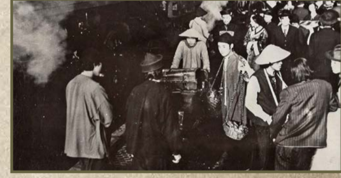
"Pánico en el Transiberiano". Estación de Delicias en Madrid.