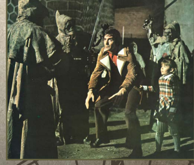
"El ataque de los muertos sin ojos" en El Vellón.