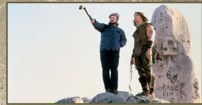
Rodaje de "Dónan, el bárbaro" en Colmenar Viejo.