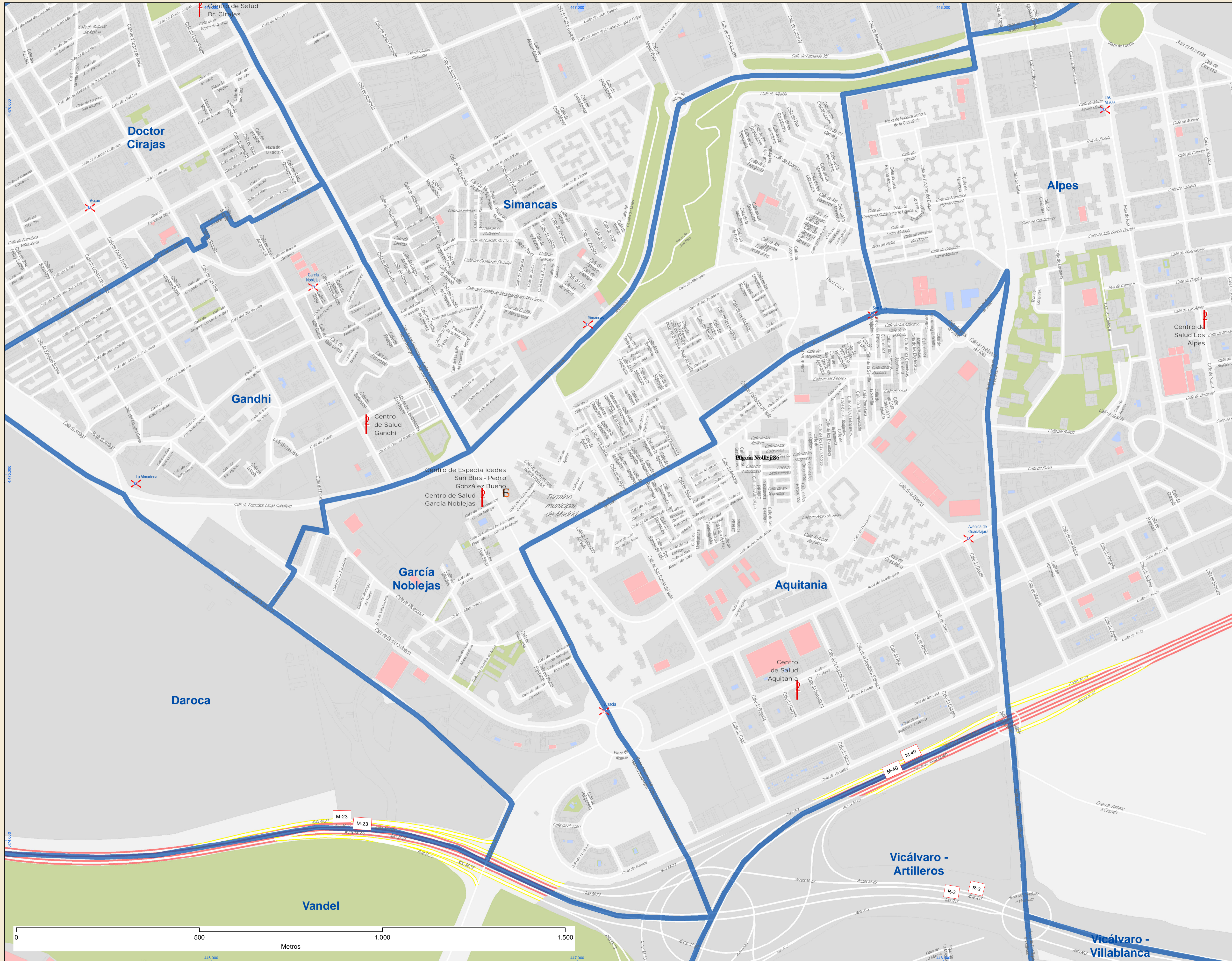
Localización en la Comunidad de Madrid